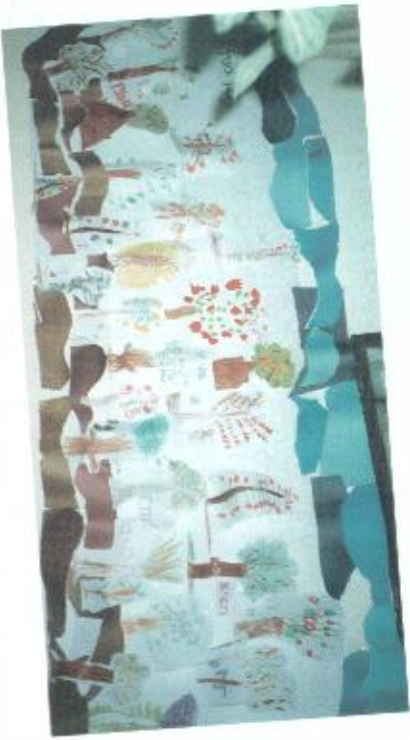
תמונת קיר, הגן בעדן

אפשר לבקש מהילדים להציע הרעבים שונים של מנות פרי לכל אחת מהארוחות. הילדים יציירו את התפרטים המוצעים.