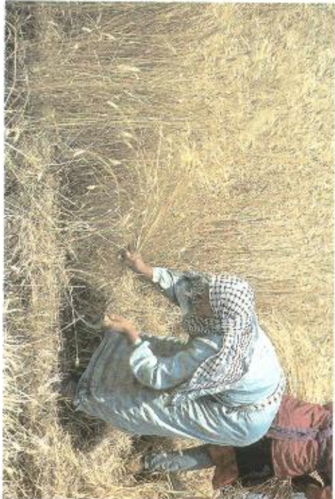
קציר חיטים בשומרון