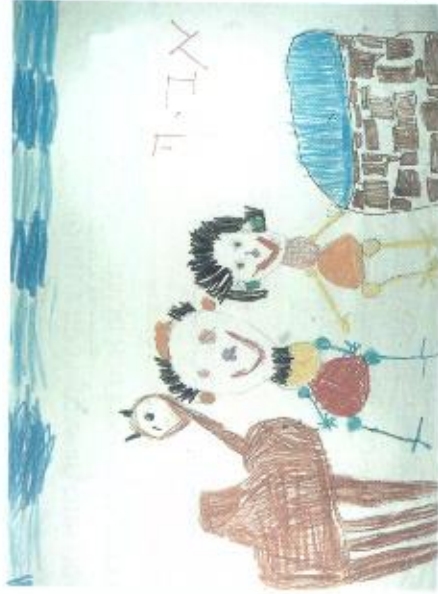
צילום המצויר: בוקי בועז

מה אתם חושבים, זה רעיון טוב? העבד יצליח? ה' יעזור לנו. השאלה נועדה לעורר בילדים ציפייה להמשך הסיפור.