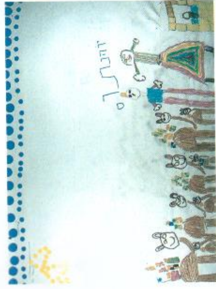
"... ותאמר גם לגמליך אשתי"

הערה: תמונות בנושא והצעות לפעילות ראו להלן בחלק יצירות אמנות.