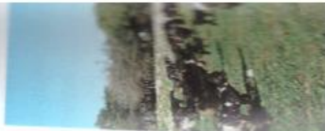
עילום: בוקי בוק