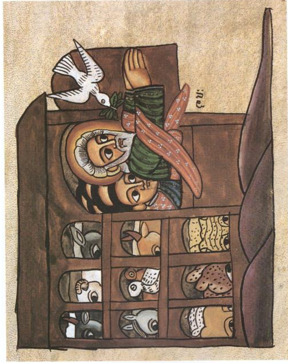
תלבת נח, אתיופיה

הערה אופן ההצגה של יחידה זו עשוי לשרת את הגנת בעיבוד סיפורי תורה אחרים, כגון אלה שלא הובאו במדריך במפורט אלא בראשי פרקים וברעיונות כלליים בלבד.