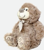
צעצועי בד וחיות פרווה