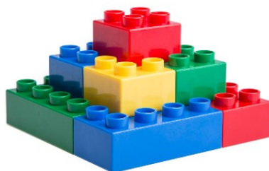
משחקי הרכבה / קליקס