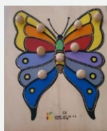
פאזלים פשוטים עם חלקים גדולים