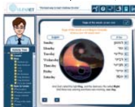
לימוד ימות השבוע במקביל לסיפור הבריאה