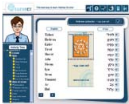
לוח שנה עברי עם דפים מתחלפים המציינים את חגי ישראל

בסיפור המסגרת משולבים נושאים מתחומי החיים השונים, כמו נסיעות, תחבורה, הבית והסביבה, קניות ובנקים, מלונות, אוכל ודיאטה, חינוך ולימודים, עבודות, ברכות, היסטוריה, חגים ומועדים, וסיפורי התנ"ך.