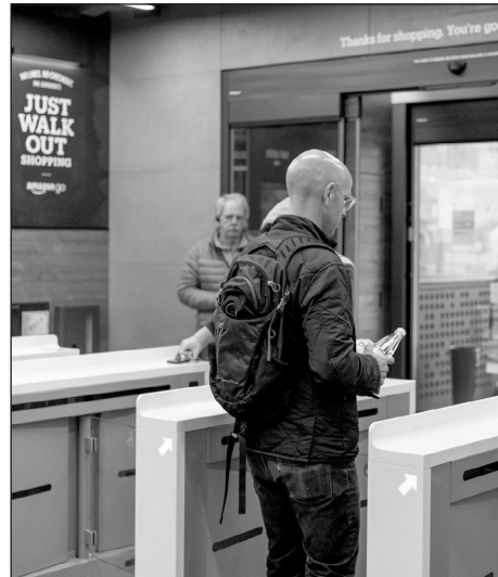
A man leaving the store

V How does Amazon plan to use this technology in the future? They don't say. However, for now, shoppers at Amazon Go should be careful. Without cashiers at the exit, it's easy to spend too much.