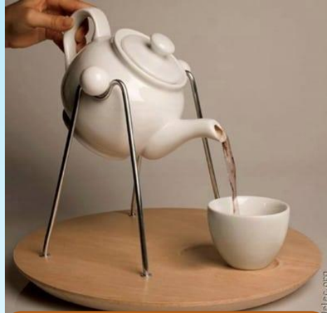
الاجسام الساخنة السوائل الساخنة