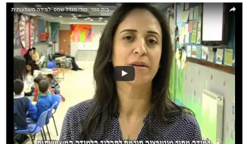
ימי למידה מחוץ לכותלי בית הספר

באתר מינהלת הטיולים ניתן לצפות בשני סרטונים המדגימים ימי למידה מחוץ לכותלי בית הספר.