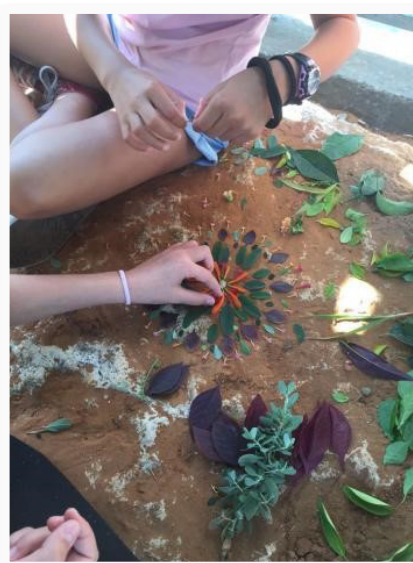
סביבות למידה ביה"ס גורדון