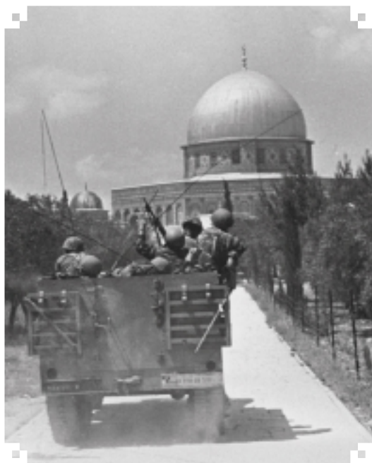
חיילי צה"ל מלימים אחר הזיג צעיר הסתיקה.

אחד ממאפייניה הבולטים של האליטה הדתית החדשה היה רצונה להפוך מקבוצת שוליים לקבוצה מרכזית המטביעה את חותמה באופן מלא בחיי