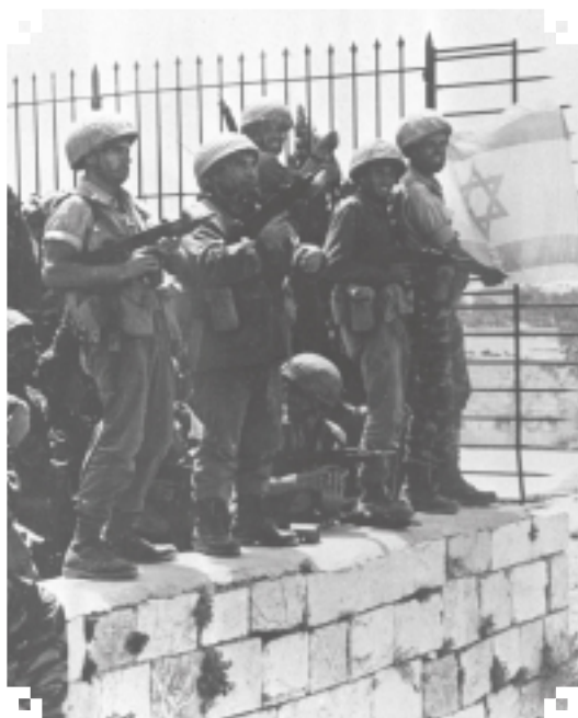
צנחנים מניקים את דגל האו"ם בצד שטח הכותל.