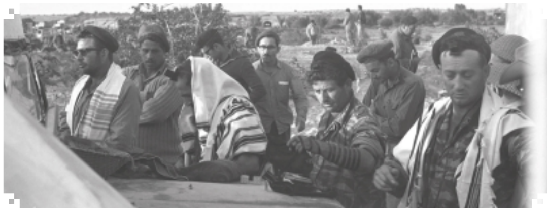
חיילים מנב"ל איתן שחריף אף אל-עריש. באצ'בז אשכנזי הממשלתי הצ'ס: איכה האן.

מיפגש שיחה בין קיבוצי, מובא ב"מלחמת המגן והישועה", עמ' 174