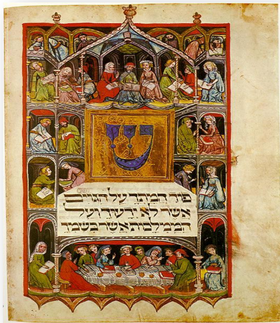
"שפוך חמתך", הגדה מעוטרת מגרמניה, המאה ה-14

הגדה של פסח היא קובץ מדרשים, מזמורי תהילים, דברי חז"ל, ברכות, תפילות ופיוטים, שנוצר כדי לאומרו בליל הסדר - הלילה הראשון של חג הפסח מסביב לסעודת החג, לקיים את מצוות "והגדת לבנך" וסיפור יציאת מצרים. הקובץ נקרא "הגדה" על פי לשון הפסוק "והגדת לבנך".