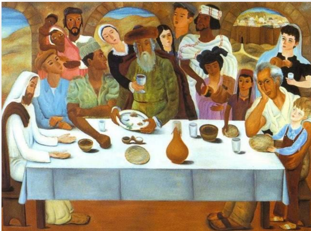
ראובן רובין, סדר ראשון בירושלים, שמן על בד, 1950

חג הפסח מתחיל בלילה מיוחד המכונה "ליל הסדר". נהגו בקהילות ישראל להזמין לסדר בני משפחה קרובים כרחוקים, עניים ואף אנשים זרים, כדי שכל אדם יוכל לאכול את סעודת החג, ולא להשאיר שום אדם מחוץ לקהילה בודד לנפשו. מצווה לספר בליל הסדר לילדים את אירועי יציאת מצרים במטרה להעביר את המורשת ואת הזיכרון לדור הבא, כחלק ממצוות "והגדת לבנך", המכוונת ללילה זה, ולכן הסדר מכוון לילדים.