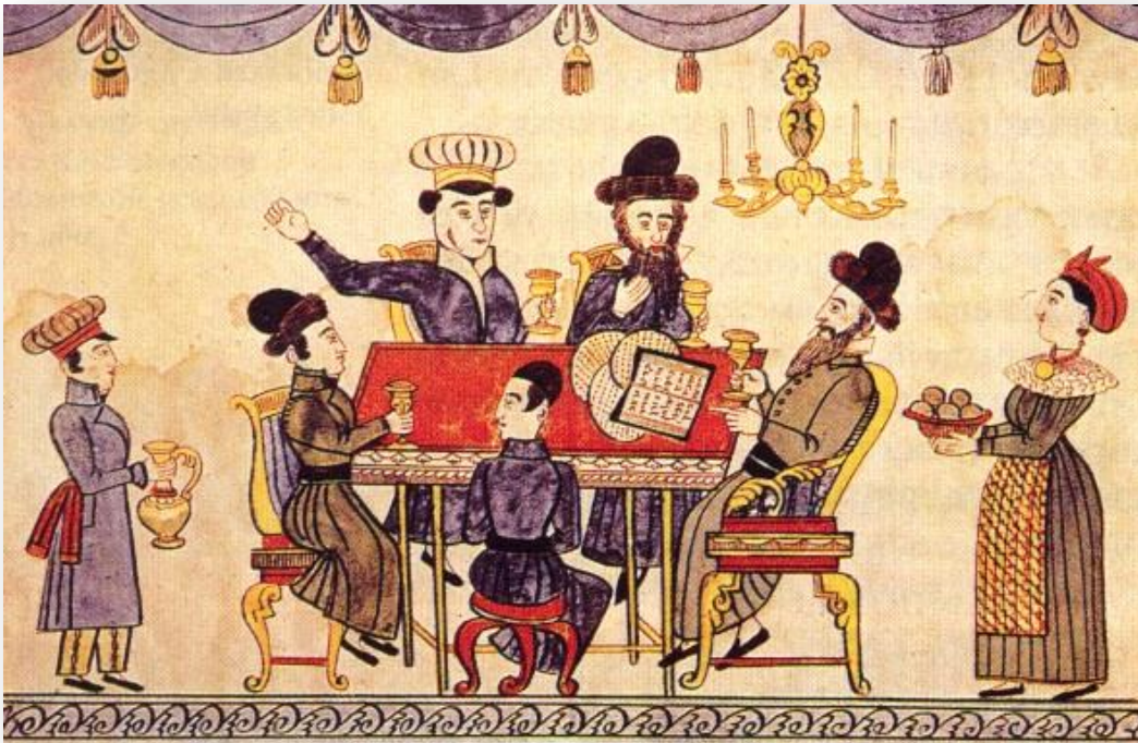
יהודים חוגגים את ליל הסדר, מתוך ספר אוקראיני מהמאה ה-19 (מתוך: ויקישיתוף, נחלת הכלל).