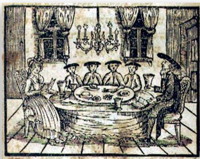
ארבעה בנים, מתוך הגדה של פסח, גרמניה, 1795, (מתוך: הזמנה לפיוט, באדיבות אוסף משפחת גרוס)

ארבעה בנים מופיעים בהגדה של פסח, המפרטת ארבעה סוגי בנים: חכם, רשע, תם ושאינו יודע לשאול , שעל פי ההגדה דיברה התורה עליהם, בצווי לספר את סיפור יציאת מצרים, וחילקה בסוגי התשובות, המתאימות לכל אחד מהם.