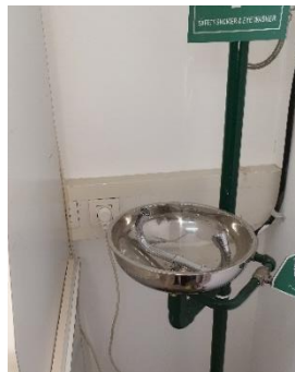
התקנה מסוכנת של משטפת עיניים בקרבת שקע חשמל