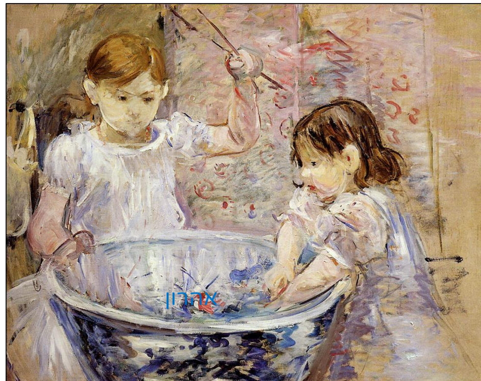
לשחק עם גיגית ופריטים נוספים, לספר וליצור סרטון