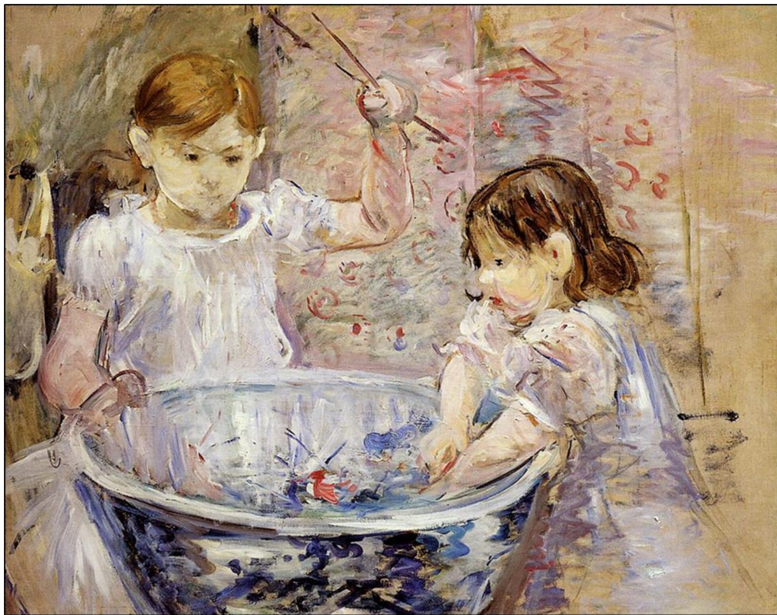
ברט מוריסו, "ילדות באמבטיה" 1886, שמן על בד