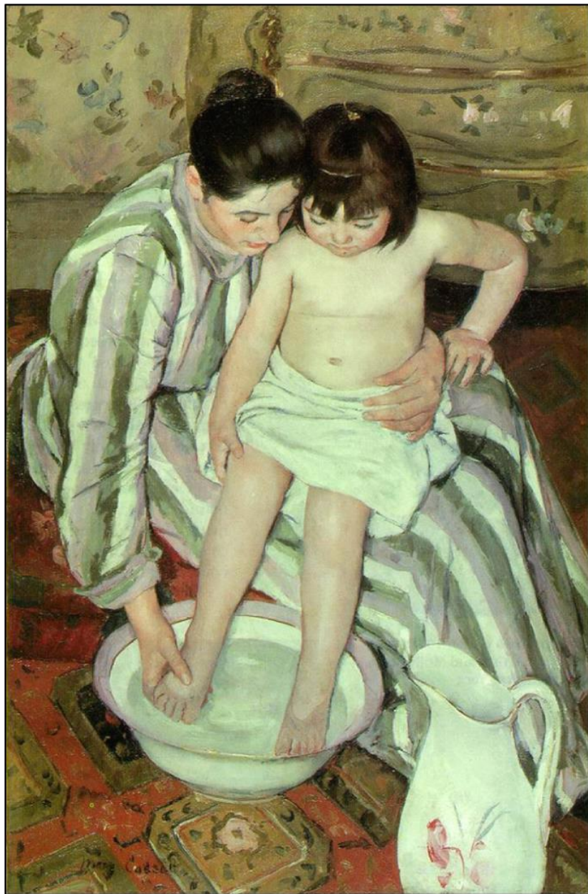
מארי קאסט, "האמבט", 1893, שמן על בד