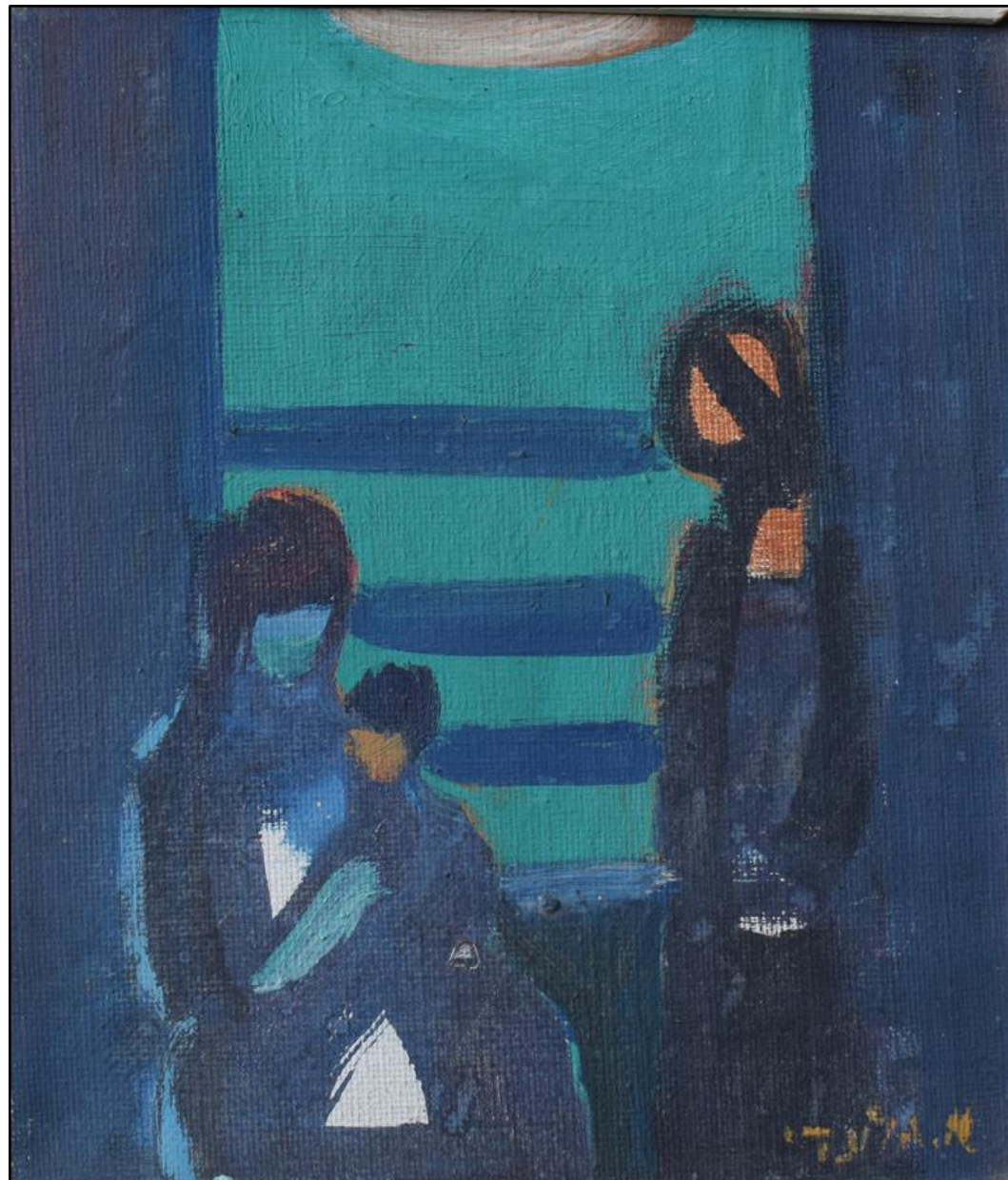
אהרון גלעדי, שנות ה-60, שמן על בד