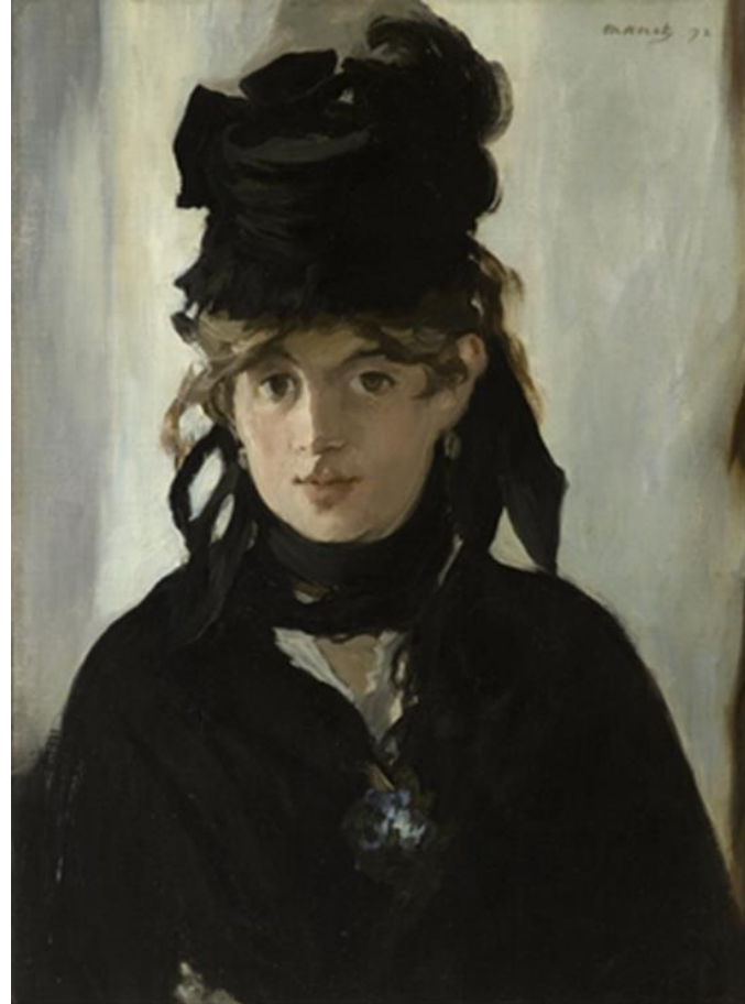
אדוור מאנה, דיוקן ברט מוריסו, 1872 שמן על בד