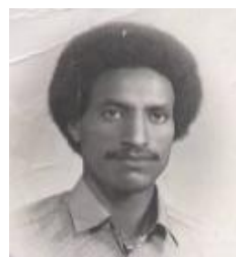
החלוץ – פרדה אקלוס