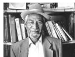
המדינאי – יונה בוגלה