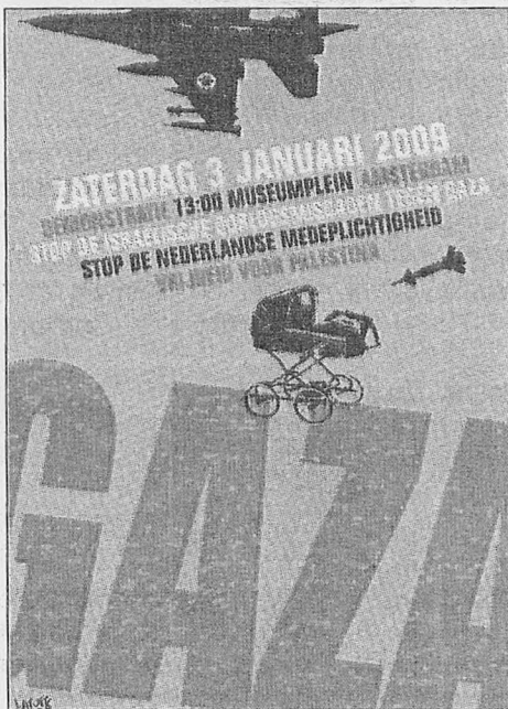
כרזה הולנדית כנגד פעולות צה"ל בעזה

אכן על היהודים להראות "מעט צניעות בחיפוש אחר דרך לחיות בשלום עם שכניהם". הרי נוכחותם בשטח זה נתונה בספק. "היה אכן מקום לשאול, ויהודים רבים אכן שאלו, האם התנחלות קהילה זו על אדמות שנרכשו בתנאים פחות או יותר נכונים ובקרב עמי ערב שהתנגדו לה נמרצות, לא היתה עלולה לגרום לחיכוכים ולסכסוכים מתמידים ואין-סופיים". כאן נקבעים בבידור "גבולות אושוויץ" שאל לה לישראל לחרוג מהם, מסגרת של מדינה מבוססת על אי-צדק, שנוסדה על-ידי עם יהודי מאז ומתמיד, שסבלו הרב עורר את חמלת המערב, אך אסור לו לנטוש את הצניעות ואת המתנינות החלות עליו בשל זכר