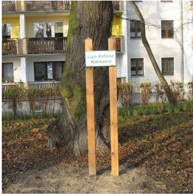
מיקום קברו של הרב צבי הירש קלישר