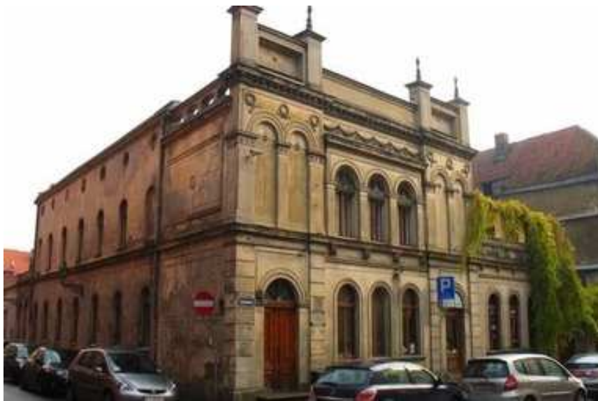
בניין המקווה לשעבר ברחוב Łazienna