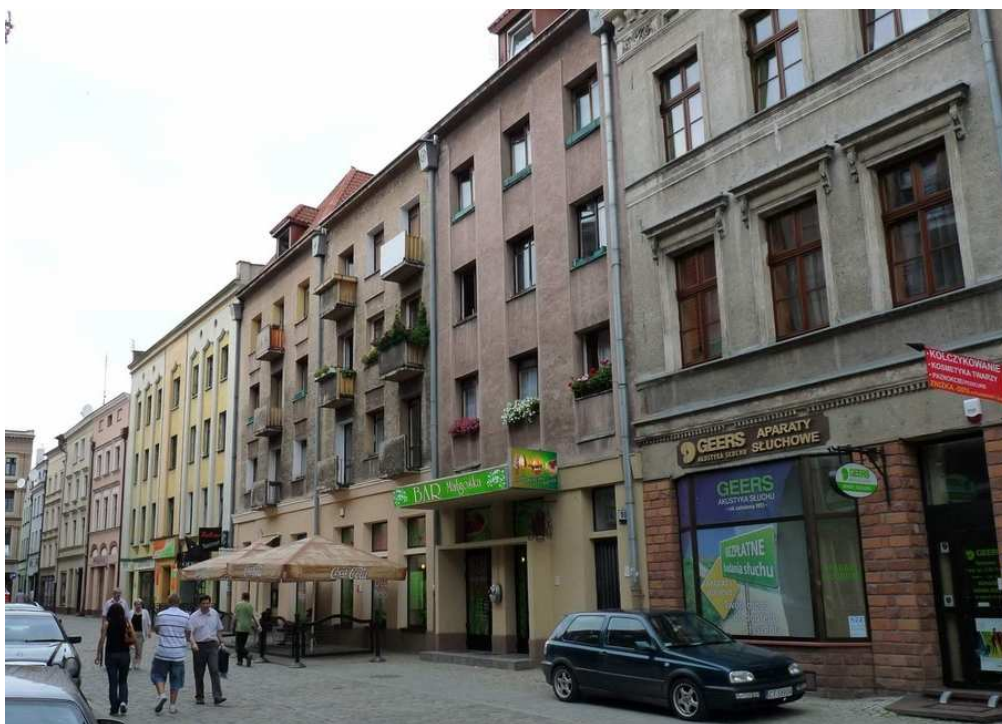
רחוב Sczytna מס' 12 – המקום בו עמד בית הכנסת הגדול