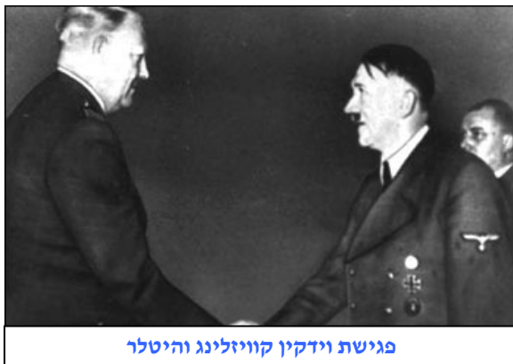
פגישת וידקיין קוויזלינג והיטלר

ערב פרוץ מלחמת העולם השנייה מנו תושבי נורבגיה 2.8 מיליון נפש. נורבגיה הצטרפה למדינות סקנדינביה האחרות בהכרזה, כי אם תפרוץ מלחמה היא תשמור על נייטרליות. ב-14 בדצמבר 1939, ביקר וידקיין קוויזלינג, עליו יורחב בהמשך,