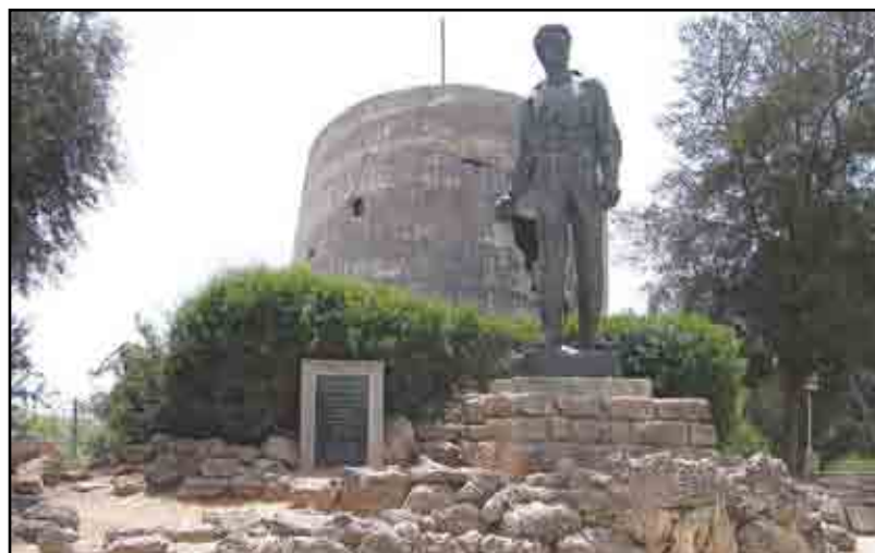
אנדרטה לזכרו של מרדכי אנילביץ', מפקד מרד גטו ורשה

האם, לדעתכם, העולם הערכי הוא מעל המציאות או שיש להתאים את העולם הערכי למציאות המשתנה?