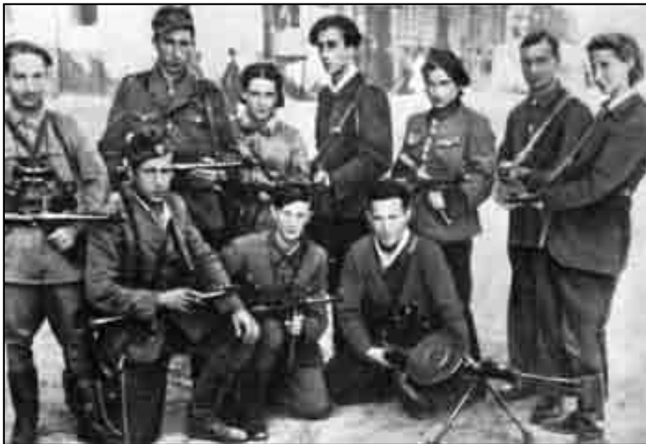
לוחמי המחותרת בגטו וילנה

הננו שוארים (כינוי לחברי התנועה), וכל חינוכנו עד עתה, כל חיינו, היו מופנים אך לארץ ישראל. שללנו מאב ומתמיד את האלות של כל אלויה. על יהדות אירופה מתרשט עתה שואה. אפשר שתצא ממנה כשהיא שבורה ברוחה, אבל אין ביטחה שהיא עומדת לפני הכחדה אמורה. ובלבה של אותה שואה נשתירנו אנו כאן, קומץ של שוארים. לאמיתו של דבר, אך מקרה הוא ששרויים הננו כאן, שהרי מקומנו בארץ ישראל, ובה קשורות דרכנו ומארתנו. אף עתה העלייה לשם היא יסוד חיינו. חייבים הננו לעשות את כל המאמצים כדי להציל מספר גדול ככל האפשר של חברינו. קיימות אפשרויות הצלה והמשק עבודה. התנועה בורשה פועילה ושם מצויים אנו להתרכב, לחבק את ההנהגה התנועתית ולעשות הכל כדי לשמור עליה. אכן, התחנכנו לקראת עבודה והיאבקות בארץ ישראל ולא כאן. מלחמה שם - עד הניצחון. היאבקות כאן בטאו יש בה רק משום הפאנה. ולנו אין כל תמיכה. אנו כשעצמנו חלשים וחסרי מאן. לעומת זאת רב כוחו של האויב. בתנאים כאלה אין כל סיכויים להיאבקותנו, והוודאות שניספה בה כולנו היא ריאלית בתכלית. וכו - אינה יכולה לשמש מורה לנו כתנועה.