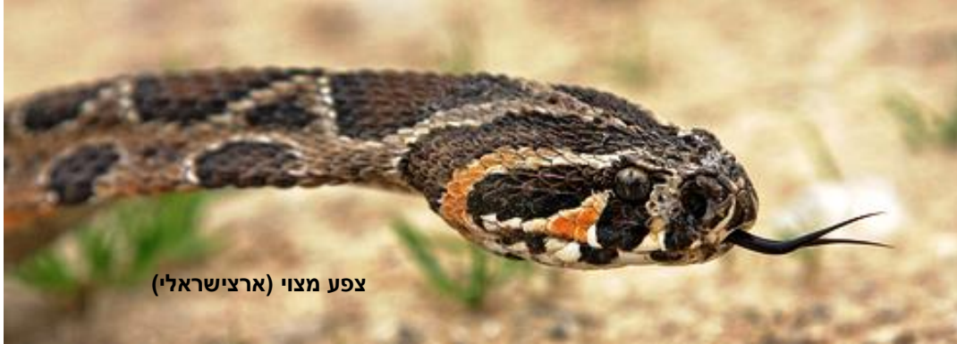
צפע מצוי (ארצישראלי)