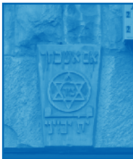
מגן דוד כעיטור מגולף באבן, מעל לכניסה למבנה מגורים משנת תרצ"ו (1936) בשכונת נחלאת שבירושלים.

המגן-דוד מורכב משני משולשים שווים צלעות המורכבים זה על גבי זה במהופך. מקורו אינו ברור. המגן-דוד, יחד עם צורה גיאומטרית דמוית כוכב בעל חמישה חודים, שנקראה חותם שלמה, היו ידועים כדוחי כוחות מזיקים. שתי הצורות מופיעות בקמעות ועל גבי קברים של עמי מזרח שונים.