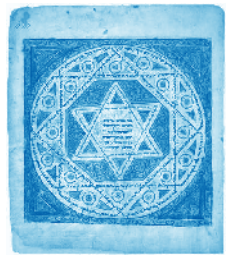
ציור קדום של מגן דוד משנת 1008 על כריכת כתב יד לנינגרד. יוצר: Shmuel Ben-Ya'aakov

המגן-דוד מורכב משני משולשים שווי צלעות המורכבים זה על גבי זה במהופך. במאה ה-19 נעשה המגן-דוד לסמל היהודי הנפוץ ביותר. התנועה הציונית הכריזה שהמגן-דוד הוא הסמל המרכזי בדגל התנועה, שנהפך לאחר מכן לסמל מדינת ישראל. בתקופת השלטון הנאצי באירופה שימש המגן-דוד כאות קלון ליהודים, והם חויבו לשאת על בגדיהם מגן דוד צהוב ובו הכתובת יהודי. כמו כן, צויר מגן-דוד על שטרות הכסף שהנאצים הוציאו לשם שימוש בגטאות.