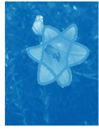
עלי הכותרת של הפרח שושן צחור יוצרים מגן דוד.