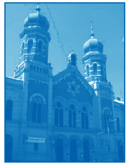
מגן-דוד בחזית בית הכנסת של פילזן, בוהמיה, צ'כיה

המגן-דוד מורכב משני משולשים שווי צלעות המורכבים זה על גבי זה במהופך. השם "מגן-דוד" מוזכר לראשונה בתלמוד הבבלי כשם של ברכה "ברוך אתה ה' מגן-דוד" (פסחים ק"ז, ע"ב). ברכה זו נאמרת בבית הכנסת, בתור קמע. על פי המסורת היהודית, דוד המלך נשא על מגינו סמל של מגן-דוד. בתורת הקבלה נחשב סמל המגן-דוד כסמל לגאולה, אשר תגיע באמצעות משיח מצאצאי דוד המלך. משיח השקר שבתאי צבי (1626-1676) אימץ את המגן-דוד והשתמש בו כסמל ל"משיחיותו".