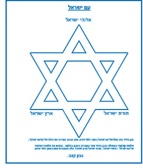
שלושת קדקודי המשולש במגן הדוד, אשר מחוברים ביניהם בצלעות, מהווים את שלושת יסודותיו של עם ישראל: אלוהי ישראל, תורת ישראל וארץ ישראל. נוצר על ידי: נבון קצב