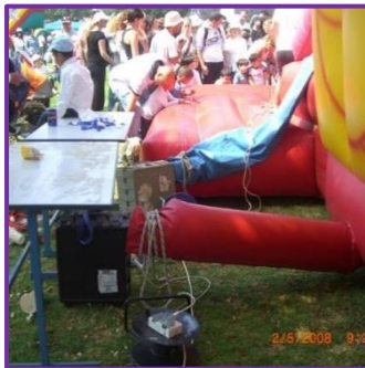
מפוח ומערכת חשמל לא מוגנים