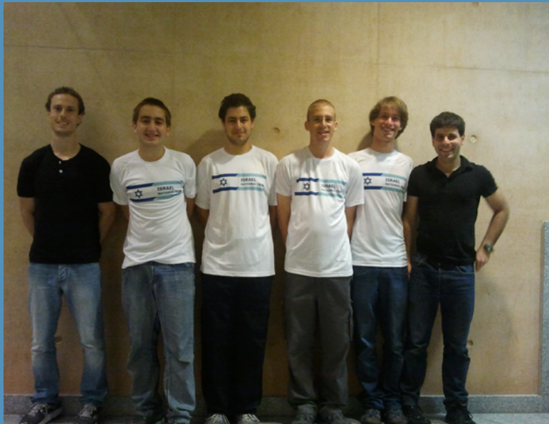
" הנבחרת הישראלית לאולימפיאדת מדעי המחשב 2013 זכתה במדליית זהב, 2 מדליות כסף ומדליית ארד"

בחודש האחרון תם שלב א' בהכנות לאולימפיאדות הבין-לאומיות במדעי המחשב ובמתמטיקה לשנת 2014. המבחן נערך בבתי הספר, ומבין המתמודדים בו יוזמנו המצטיינים להשתתף בשלב הבא במיונים, ולאחריו יורכבו הנבחרות שייצגו את מדינת ישראל בתחרויות לשנה זו. האולימפיאדה הבין-לאומית במדעי המחשב תיערך השנה בטיוואן, ובדרום אפריקה תתקיים אולימפיאדת המתמטיקה. בשנה החולפת הנבחרות הישראליות הגיעו לדירוגים גבוהים בשני המקצועות וזכו להישגים מרשימים. אנו מאחלים בהצלחה לכל המתמודדים!