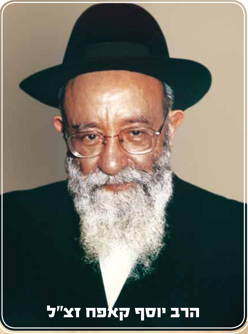
הרב יוסף קאפח זצ"ל