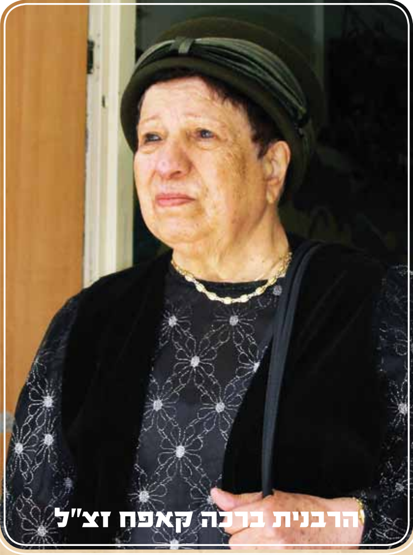
הרבנית ברכה קאפח זצ"ל