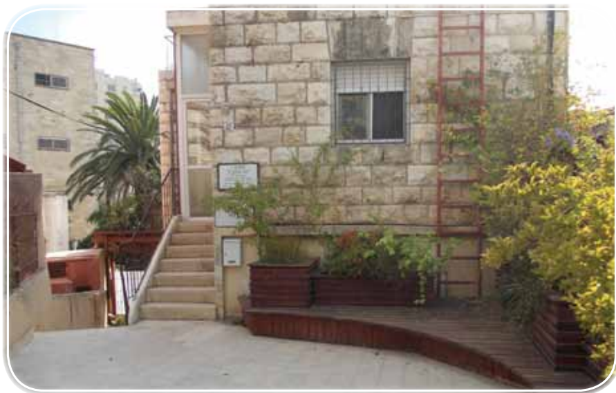
הבית ברחוב לוד

הביטו בביתם של הרב יוסף והרבנית ברכה קאפח זצ"ל. לאור מה שלמדת עליהם ולאור הסיפורים ששמעת, כתוב: