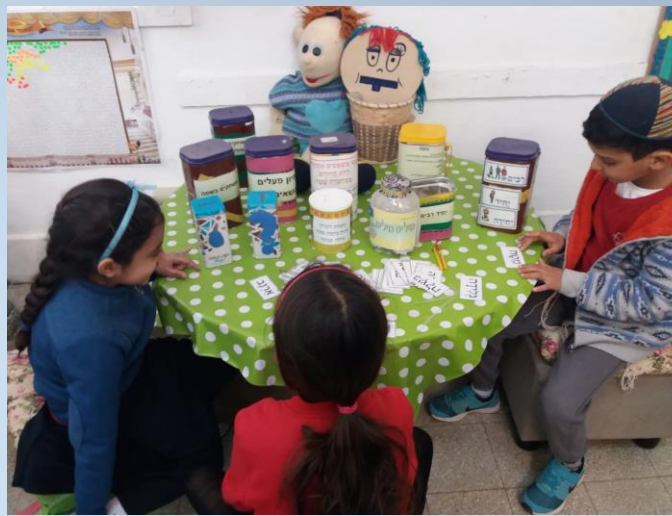
מרכז למידה קריאה כיתות א' ב'