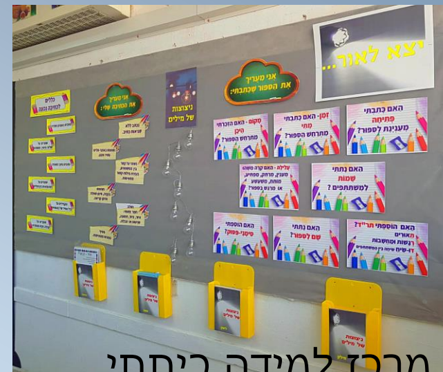
מרכז למידה כיתתי