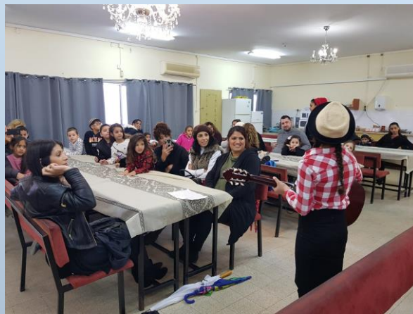
רצף גנים בקריאה- "תפארת המספרת"