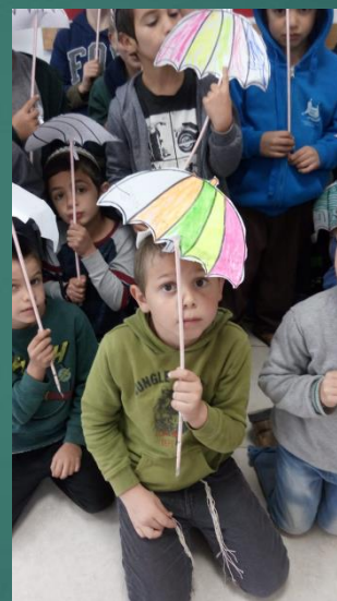
מטריה באות ט'