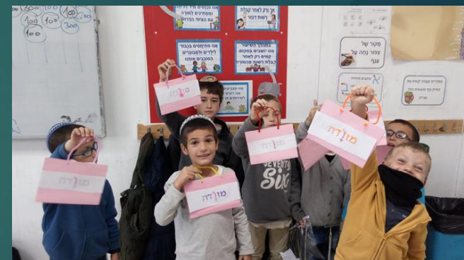
מזדה באות ו'