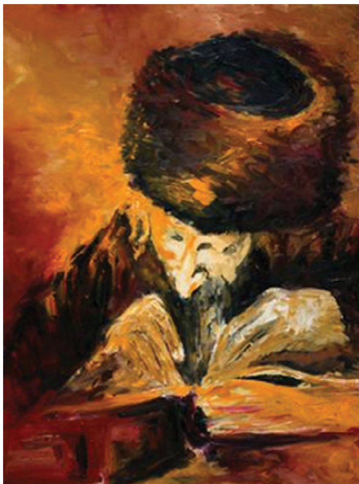
צור: חני עמנואל

לעד חיה בלבנו, האמונה הנאמנה, לשוב לארץ קודשנו, עיר בה דוד חנה.