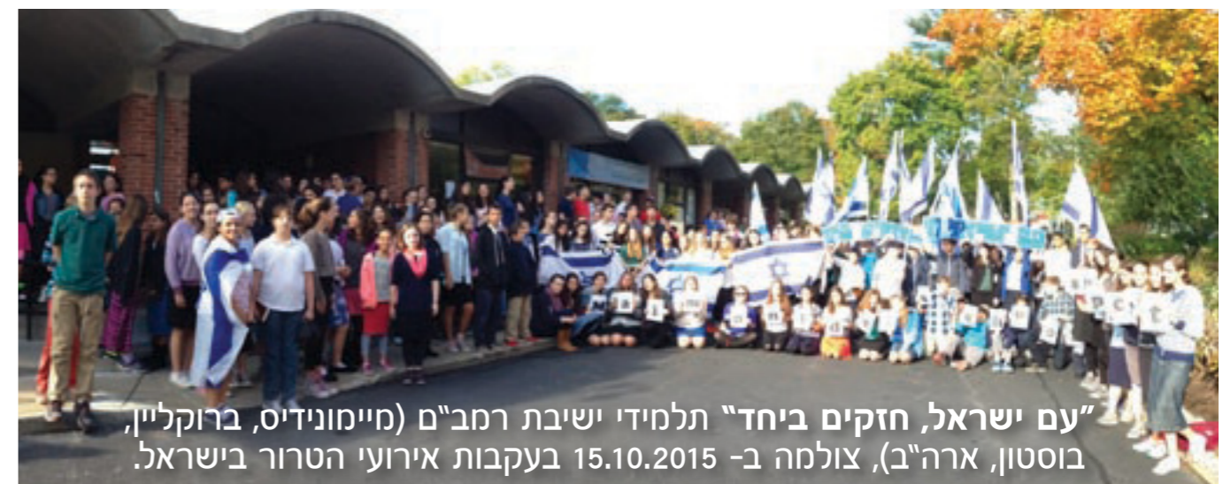
"עם ישראל, חזקים ביחד" תלמידי ישיבת רמב"ם (מיימונידיס, ברוקליין, בוסטון, ארה"ב), צולמה ב- 15.10.2015 בעקבות אירועי הטרור בישראל.