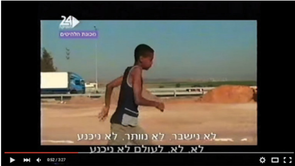
לקישור: שיר אמונה קצת אחר על אמונתם של נוער יהודי אתיופיה - "עדה שלא מאבדת אמונה"

גרמי קול חבש עם קבוצת שדרות - קליפ שיר האמונה, לא מאבדים תקווה