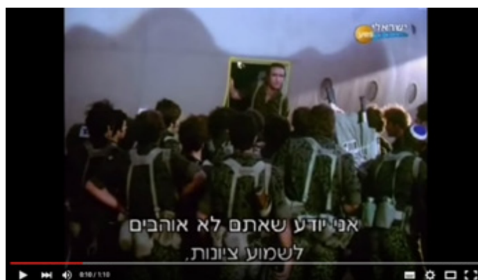
הקישו ב-youtube: נאום ציונות במבצע יונתן