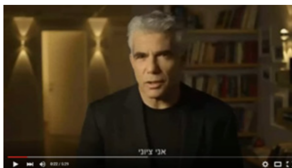
הקישו ב-youtube: אני ציוני - יאיר לפיד

הסרטונים שלהלן עוסקים בשאלה מהי ציונות? צפו בסרטונים והשיבו על השאלות