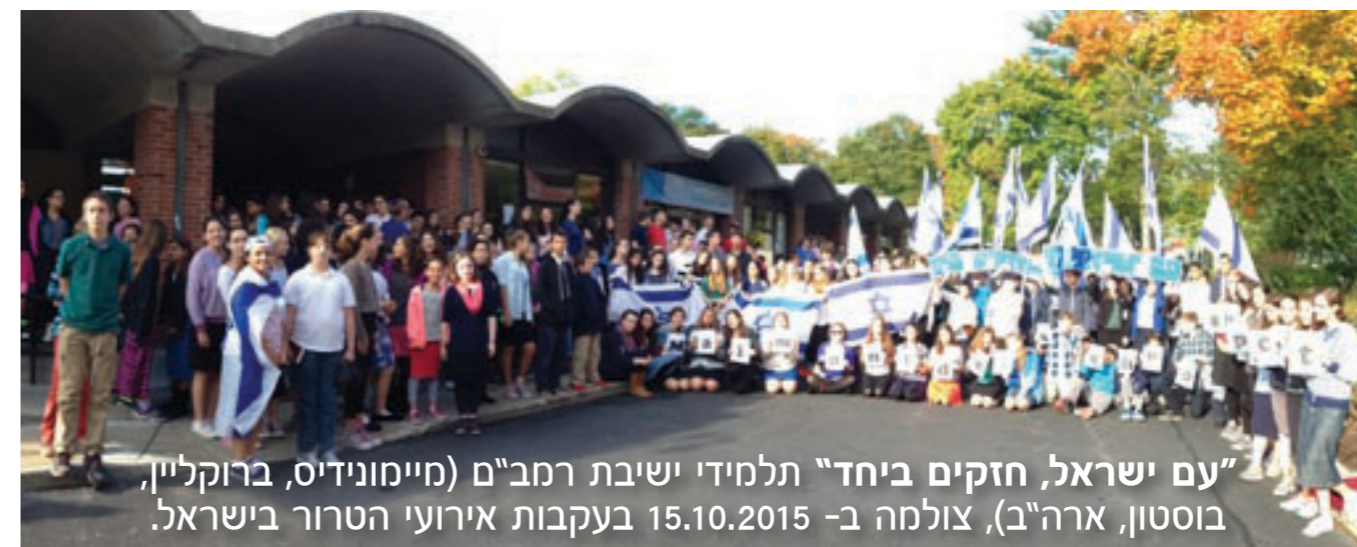
"עם ישראל, חזקים ביחד" תלמידי ישיבת רמב"ם (מיימונידיס, ברוקליין, בוסטון, ארה"ב), צולמה ב- 15.10.2015 בעקבות אירועי הטרור בישראל.