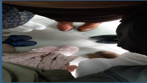
נערות הגבעות בנעלי בית במפגשים מכספי מנ"ע