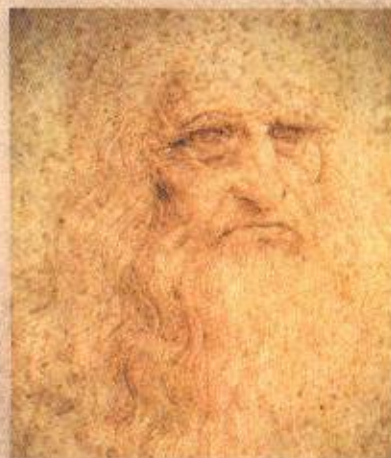
דיוקן עצמי של ליאונרדו דה וינצ'י