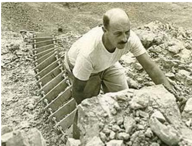
יגאל ידין במצדה

דמותו של יגאל ידין שזורה בנוף ירושלים. הסיור בעקבותיו חושף רבדים של עבר והווה, של עתיק,