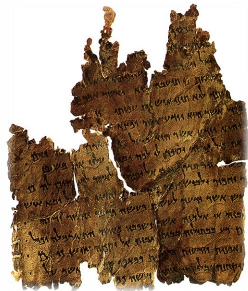
המגילות הגנוזות, מתוך: ויקיפדיה

(פרופסור אברהם מלמט, האוניברסיטה העברית)