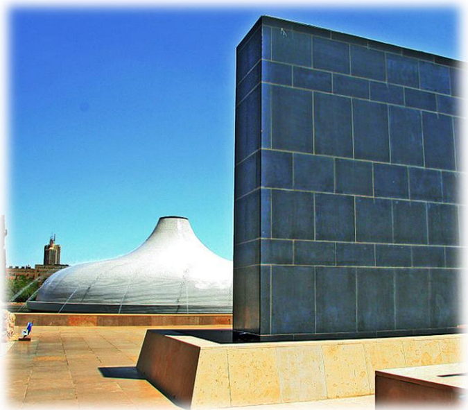
היכל הספר