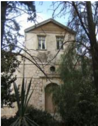
המרפאה והבית של דר' כגן

ד"ר הלנה כגן (1887-1978) הייתה רופאת ילדים והאישה הראשונה בארץ ישראל ששימשה במקצוע זה. ד"ר כגן הגיעה לארץ ישראל בשנת 1914 ולא קיבלה אישור לעסוק ברפואה מהשלטון העות'מאני בשל היותה אישה. בשנת 1914, פרצה מלחמת העולם הראשונה והטורקים נזקקו נואשות לכוח אדם רפואי. אז גויסה גם הלנה כגן, אם כי כאחות ולא כרופאה, לעבודה בבית החולים העירוני . בסופו של דבר, קיבלה ד"ר כגן רישיון עבודה כרופאה ואף הגיעה לדרגת ניהול בבית חולים זה.