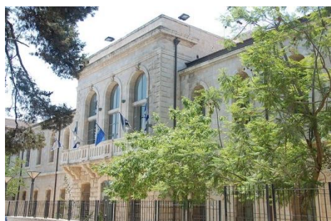
בית חולים "שערי צדק"