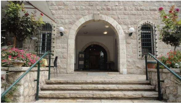
בית טיכו

בית טיכו הוא אחד הבתים הראשונים בירושלים שנבנו מחוץ לחומות העיר העתיקה. הבית שימש למגוריהם ולעבודתם של הציירת אנה טיכו ובעלה הרופא החוקר אברהם אלברט טיכו – שהיו דמויות בולטות בחברה הארץ-ישראלית בתחילת המאה ה-20.