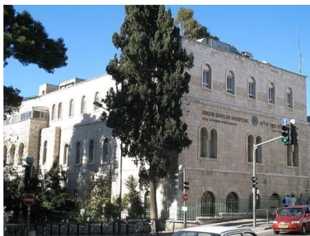
בית חולים "ביקור חולים"

בסמוך לבית החולים של המיסיון. בשנת 1925, נחנך בית החולים החדש מחוץ לחומות עוד לפני שהושלמה בניית הקומה השלישית בו. במלחמת השחרור, היה לבית החולים תפקיד מרכזי כמוסד רפואי בירושלים – בעיקר לאחר ניתוק הקשר בין ירושלים המערבית לבית החולים "הדסה" בהר הצופים. הקרבות בעיר העתיקה גרמו לנתק בין בית החולים החדש והישן – הישן נותר בידי הלוחמים הערבים. אך טרם הסתלקות הבריטים מהארץ, הצליחו עובדי בית החולים לפנות ממנו את כל החולים בחסות הצבא הבריטי. רק שנים רבות לאחר המלחמה, בשנת 1959, הושלמה בניית הקומה השלישית של בית החולים. בדצמבר 2012, אוחד בית החולים עם המרכז הרפואי "שערי צדק" והיה לחלק ממנו. במבנה שברחוב הנביאים ממשיכות לפעול כיום רק מספר מצומצם של מחלקות.