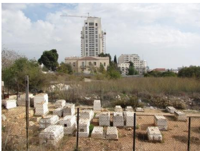
בית העלמין "שערי צדק"