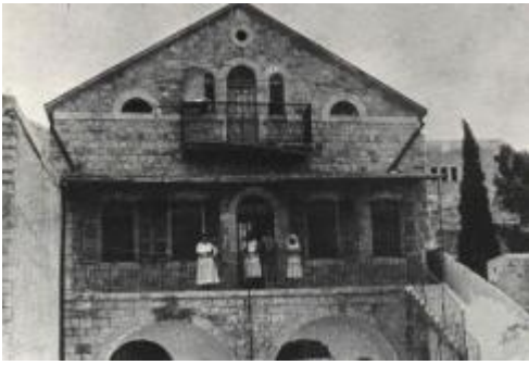
בית חולים משגב לדך

בית חולים "משגב לדך" (1) , רחוב משגב לדך 26 ברובע היהודי