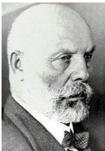
מנחם אוסישקין , מתוך: ויקיפדיה

מנחם אוסישקין (1863-1941) נמנה על ראשי תנועת ”חיבת ציון” ועל ראשי הציונות. אוסישקין פעל רבות לרכישת קרקעות להתיישבות יהודים בארץ. אוסישקין נולד ברוסיה הלבנה (בלארוס). בעקבות הפוגרומים ביהודים – סופות בנגב (1881) – הקים ”אגודה של עולים לארץ ישראל” לאיסוף כספים למטרה זו. אוסישקין ביקר בארץ ישראל לראשונה בהיותו בן 28 ובשובו לרוסיה עסק גם בתעמולה ציונית ובפעילות תרבותית. בשנת 1896, נפגש עם הרצל בווינה והיה לתומכו הנלהב. כעבור שנה, החל להשתתף בקונגרסים הציוניים ועד סוף ימיו היה פעיל בהסתדרות הציונית. בעקבות פרעות קייסינב