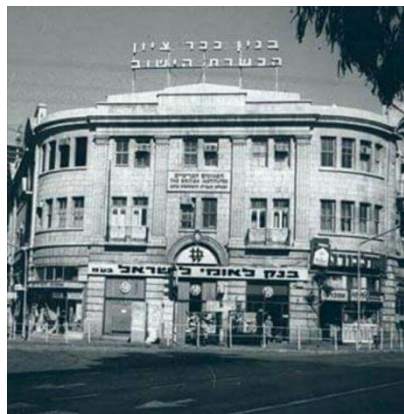
מוסדות הכשרת היישוב

הכשרת היישוב הייתה חברה ציונית מיישבת שפעלה בתקופת היישוב ובארבעים שנותיה הראשונות של המדינה עד שנת 1988. בראש החברה עמדו ד"ר ארתור רופין, פרופ' אוטו ורבורג וד"ר יעקב טהון. בתקופה הראשונה לפעילותה, התרכזה החברה ברכישת קרקעות להתיישבות חקלאית. בתום מלחמת העולם הראשונה, עסקה, בשיתוף עם הקק"ל, גם ברכישת קרקעות להתיישבות עירונית ורכשה את אדמות השכונות תלפיות ורחביה בירושלים. בשנים הראשונות לכיבוש הבריטי, מנע הממשל רכישת אדמות פרטיות בארץ ישראל, אולם איסור זה בוטל ב-1920 בזכות ההבנה כי הכשרת היישוב פועלת לתועלת הציבור.