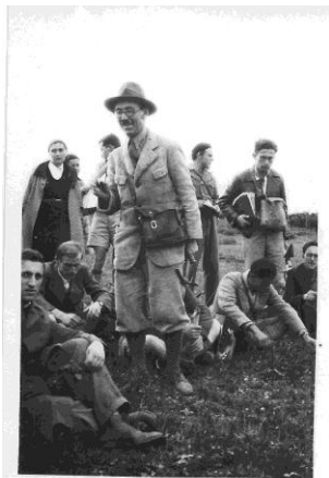
פרופ' איג עם תלמידיו

הגן הבוטני בהר הצופים (7), רחוב שומרי ההר, הר הצופים