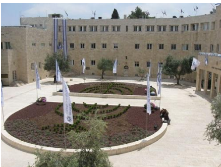
בניין המוסדות הלאומיים

בשנת 1933, ביום הולדתו ה-70, החליט אוסישקין שמן הראוי שהרחוב המרכזי בשכונה, הניצב לרחוב קק"ל, ייקרא על שמו. צוותים של עובדי קק"ל נשלחו לקבוע את שמו בשלטי קרמיקה מהודרים ולהסיר את שמו של רבי יהודה הלוי. תושבי השכונה ניסו למחות, אבל כוחו של אוסישקין והשפעתו היו גדולים, וב-1936 נקבע השם החדש רשמית גם במפות.