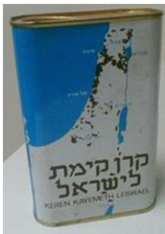
הקופסה הכחולה