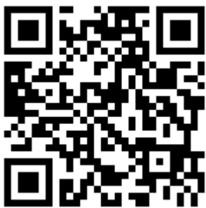
זונם פה וזונם שם , שיר, מתוך: יוטיוב

יהודה האזרחי תיאר בספרו גם את טקס קבלת דגל ירושלים ביום הדגל: