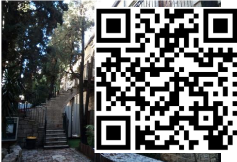
בית הרב קוק

הרב אברהם יצחק הכהן קוק היה הרב הראשי האשכנזי הראשון בארץ ישראל, פוסק, מקובל והוגה דעות. הוא נחשב לאחד מאבות הציונות הדתית. הרב קוק נתמנה לרבן של יפו והמושבות, ולאחר מלחמת העולם הראשונה לרבה האשכנזי של ירושלים. הוא הקים את הרבנות הראשית לארץ ישראל וכיהן כרב הראשי האשכנזי הראשון, וכן ייסד את ישיבת "מרכז הרב". בשל מעמדו של