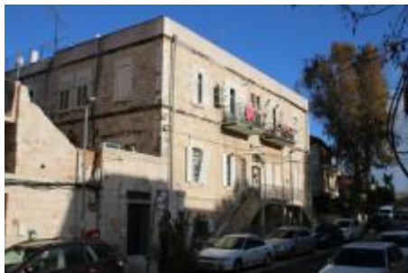
הע"ח 19-21, הבית הראשון שבו גרה משפחת מרציאנו.

בבית זה גר סעדיה עד סיומה של מלחמת ששת הימים. מגיל 11 עד גיל 14, שהה במוסד לעבריינים צעירים, ובגיל 21 החל להיות פעיל ב"פנתרים השחורים". אחיותיו סיפרו על רצונו העז לעזור לאנשים לצאת מן המצוקה. מרציאנו ראה את האפליה הממסדית המקפחת והחליט לפעול למען צדק חברתי. לשיטתו, מטרת הארגון הייתה לשאת את גלימת המאבק שההורים לא יכלו לשאת שכן "ההורים לא דיברו" ומבחינתם מצבם היה גזרת גורל, בגדר "הכול מאלוהים" (שם).