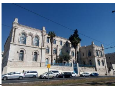
בית החולים הצרפתי