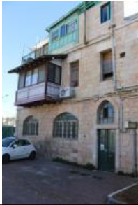
רחוב משמרות 10