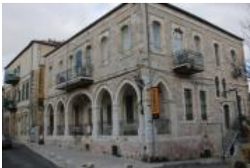
בית ספר "בית יעקב", היום בית ספר לצילום ע"ש נגר, רחוב הע"ח 9

כמו מרבית הבתים ברחוב זה, נבנה גם בית הספר "בית יעקב", היום בית ספר לצילום, בראשית המאה ה-20. בתום מלחמת העצמאות, הותאם המבנה לשמש בית ספר לזרם החרדי. ועדת פרומקין קבעה כי יש לנתק את החינוך מהפוליטיקה ולהקים שני זרמים חינוכיים נפרדים – דתי וחילוני. בנוסף, הוקם זרם חינוך חרדי, המוכר בשמו החינוך העצמאי . היות ומרבית העולים