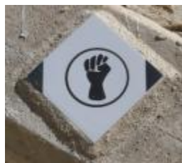
סמל "הפנתרים השחורים", על מדרגות רחוב הע"ח 21

אחת הפעולות הראשונות של "הפנתרים" הייתה למצוא שטח לגן ילדים. השטח שנבחר נוקה, נתחם ביריעה ירוקה, והגן החל לפעול לרווחת ההורים העובדים. טדי קולק , ראש עיריית ירושלים דאז, לא אהב את הביצוע, ולאחר זמן מה נבנה גן ילדים חלופי (אברג'יל ראובן בסיור בתערוכה של צילומי יעקב שופר במוזאון ישראל ביום 7.2.2017). בשנת 1971, באחת ההפגנות שקיימו "הפנתרים השחורים", קרא לעברם קולק: "תרדו מהדשא, פרחים". קריאה זו המחישה את הניתוק הממסדי מהשכבות החלשות (חסון ניר, 40 שנה אחרי מוסררה נותנים כבוד לפנתרים , הארץ ).