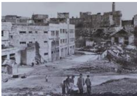
בית טאנוס (17) , רחוב מיטיבי נגן

לאחר מלחמת ששת הימים, החלו לשפר את חזות העיר ולפתחה תרבותית וכלכלית. האדריכל משה ספדיה וראש העיר דאז טדי קולק הגו תכנית לבניית מתחם "הכול כלול בו" – מרכז קניות ובילויים, מלונות ובתי מגורים לעשירים, משרדים וחנייה תת-קרקעית. הפרויקט חייב הריסת כל המבנים בשכונת ממילא ופינוי תושבי השכונה. המתכננים לא העלו על דעתם לשמר אתרים היסטוריים וארכיטקטוניים ייחודיים שהיו בשכונה, כמו בית שטרן, הבית שבו לן הרצל בביקורו ההיסטורי בירושלים בשנת 1898. התכניות עוררו תגובות רבות, בעד ונגד הפרויקט, ו-38 שנים עברו עד להשלמתו.