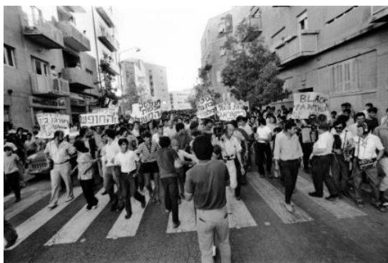
הפגנת "הפנתרים השחורים" בירושלים