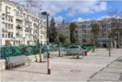
שיכוני רכבת משנות השישים

שכונת שמואל הנביא הוקמה צפונית לשכונת מוסררה והיא השכונה היהודית הצפונית ביותר בשכונות שהיו על ה"קו העירוני".