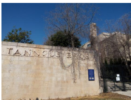
שריד לבית טאנוס

בפיתוח מתחם ממילא, פונו תושבי בית טאנוס, מרביתם כורדים, תמורת פרוטות או שנכסיהם הופקעו וניתן להם עבורם פיצוי כספי זעום. הבניין נהרס לחלוטין. איש לא נתן דעתו לשימור אתרים היסטוריים. רק לאחר מעשה, שוחזר