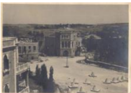
שער מנדלבאום , מאי 1949

מעבר מנדלבאום, או שער מנדלבאום , נקרא על שם בית משפחת