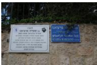
פינת סעדיה מרציאנו פינת הרחובות הנביאים ושבטי ישראל

סעדיה מרציאנו נולד במרוקו בשנת 1950 לאליהו ועליזה מרציאנו. כשנה לאחר לידתו, עלתה משפחתו ארצה ממניעי ציונות ואהבה לארץ ישראל. בעלייתה, היו במשפחה שישה ילדים ובארץ נולדו חמישה ילדים נוספים. המשפחה, שכאמור מנתה 13 נפשות, התגוררה תחילה ברחוב הע"ח 21 ולאחר מלחמת ששת הימים עברה להתגורר בשיכון רכבת ברחוב דניאל 15. סעדיה מרציאנו היה ממייסדי " הפנתרים