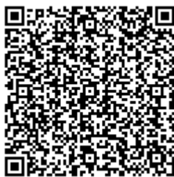
מעשה בשיניים תותבות – סיפורו של הקו העירוני

אחת האפיזודות המתארות את מרקם החיים על קו התפר קשורה לאחות נזירה בבית החולים. שיניה התותבות של האחות נפלו הישר אל בין גדרות התיל של שטח ההפקר, וכדי להשיבן אליה, נאלצו נציג ישראלי, נציג ירדני ונציג מהאו"ם להגיע למקום כדי למנוע תקרית דיפלומטית ולמנוע את הגברת המתיחות לאורך קו הגבול.