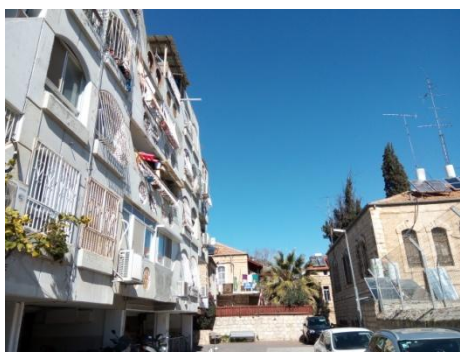
שיכוני הרכבת

ברחוב דניאל, שני טורי בתים של שיכוני רכבת שנבנו בראשית שנות השבעים של המאה ה-20. גודל כל דירה בבתים הוא כחמישים מטרים רבועים, שטח שלא התאים למשפחות מרובות הילדים שעברו לכאן מבתים אחרים במוסררה. "שרוול", מעין גשר מחבר בין בית מספר 15 ובית מספר 16, שאליו עברה משפחת מרציאנו. המשפחה גרה קודם בבית שלו הייתה גינה, אמנם בצפיפות מה, אך שכנעו אותם לעבור לדירה, והם לא ידעו עד כמה תהיה צפופה ולא ידעו