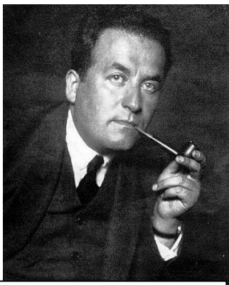
ש"י עגנון

שמואל יוסף (ש"י) עגנון (צ'צ'קס) (1887-1970) נולד בעיירה בוצ'אץ שבגליציה המזרחית (באוקראינה של היום). מילדותו, שקד על לימוד המסורת התרבותית היהודית וכן הרחיב את השכלתו