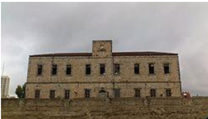
בית ספר אליאנס

בית ספר "אליאנס" נפתח בעיר בשנת 1880 ונסגר בשנות הארבעים של המאה ה-20. בית הספר היה חלק מרשת בתי הספר "אליאנס", כל ישראל חברים, כ"ח", שהראשון בהם נוסד במרוקו. שפות ההוראה ברשת כ"ח היו עברית וצרפתית. "אליאנס" היה אחד מבתי הספר המודרניים הראשונים בירושלים.