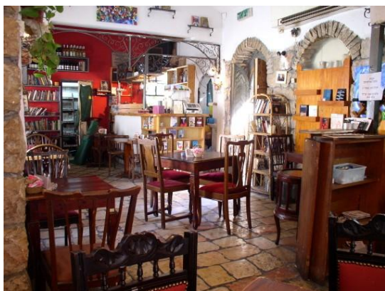
מסעדת תמול שלשום

השכונה עברה תהפוכות ושינויים רבים במהלך השנים. כיום היא אחד ממוקדי הבילוי וההווי של