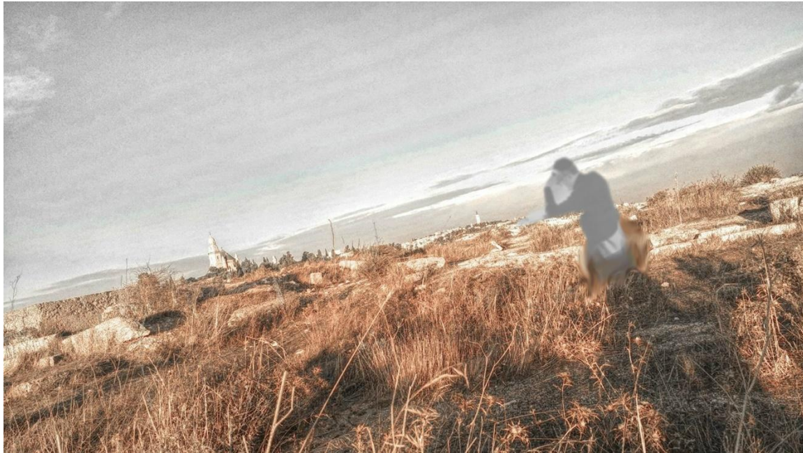
שי עגנון בנוף ירושלים