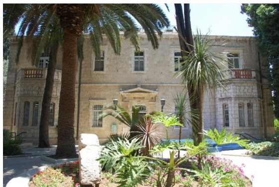
בית מחניים