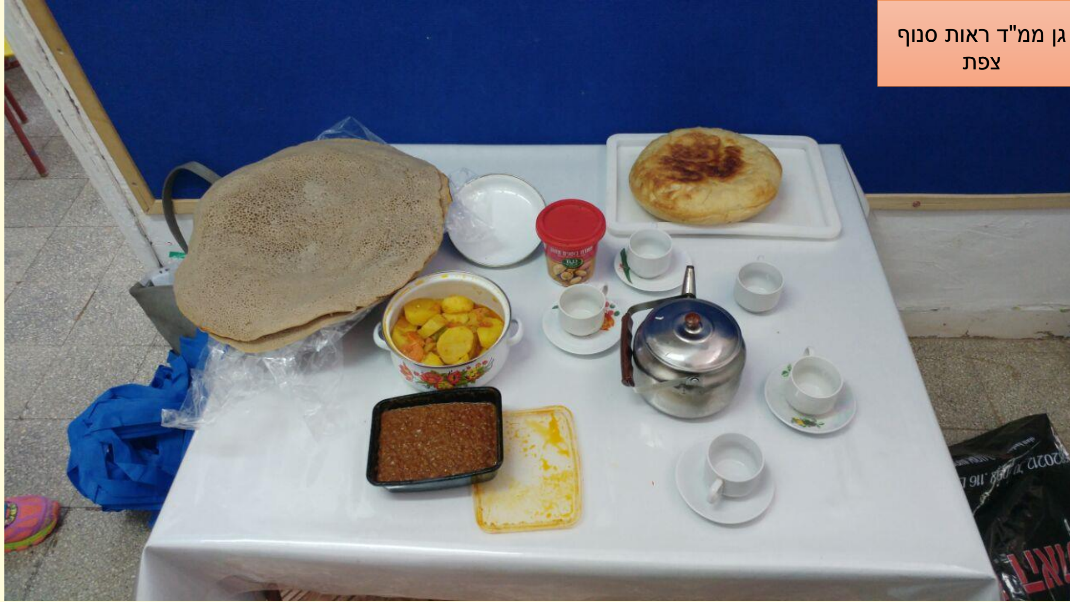
גן ממ"ד ראות סנוף צפת