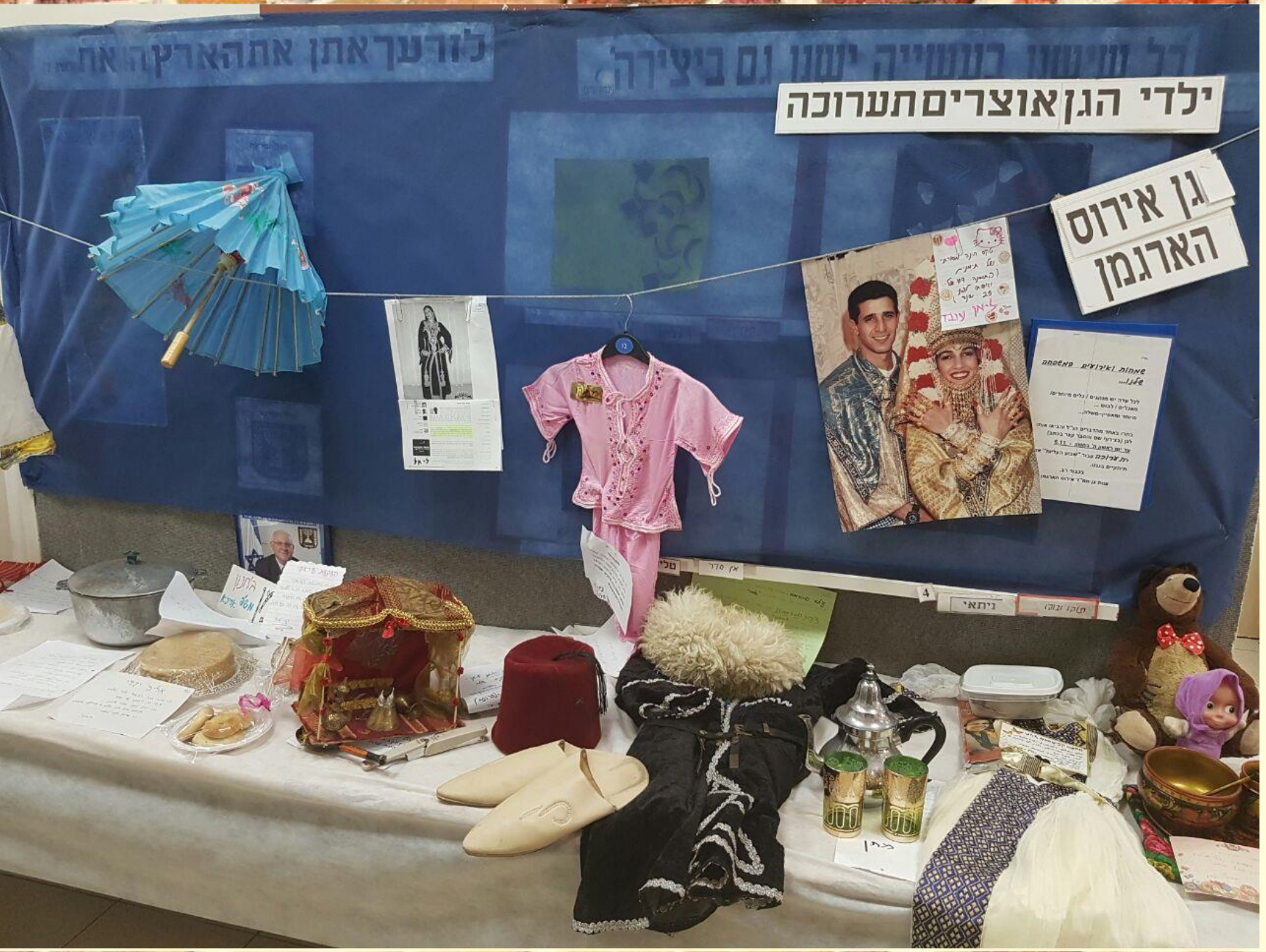
גן אירוס הארגמן נתניה