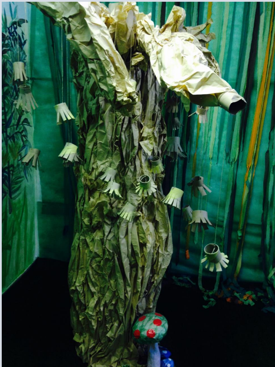
במרכז "צליל וצבע", כפר יונה