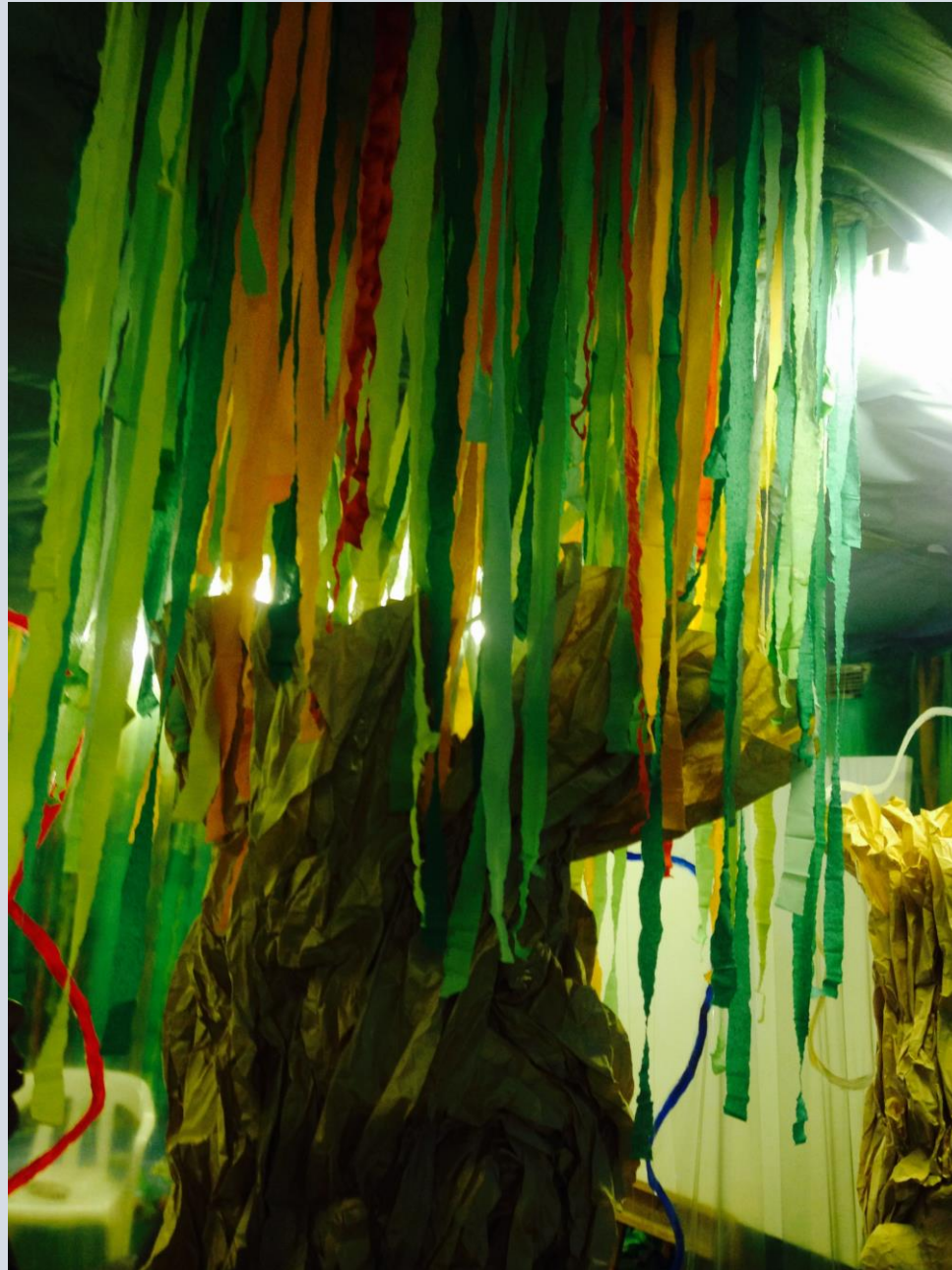
במרכז "צליל וצבע", כפר יונה