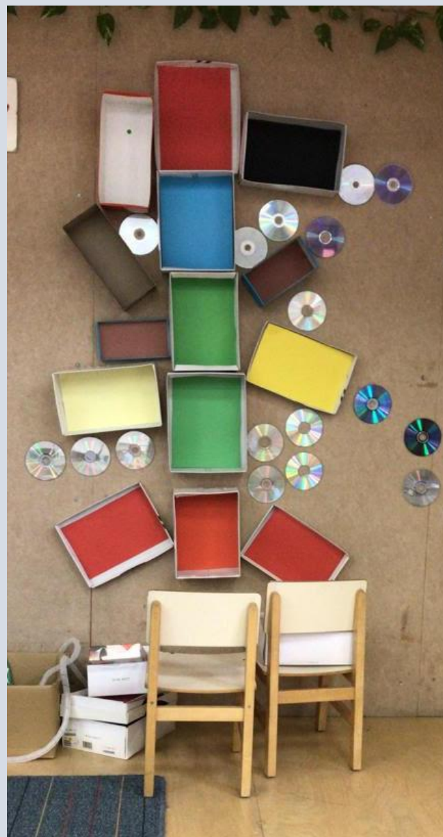
שקמה באשכול לב, תל אביב בהנהלת ורד דניאלי