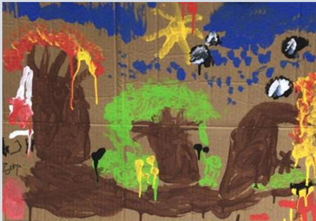
שקמים באשכול לב, תל אביב בהנהלת ורד דניאלי