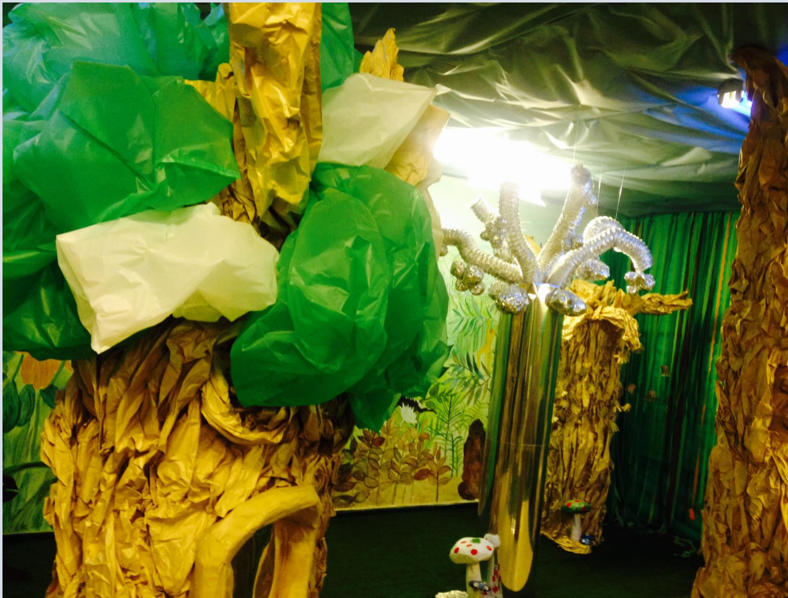
חורש במרכז "צליל וצבע", כפר יונה