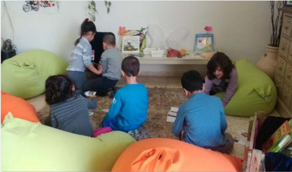
הפנינג פרפרים, פינת עיון ופעילויות בעקבות סיפורים על פרפרים