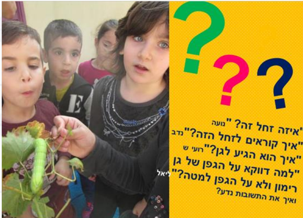
הילדים ביחד עם הגננות חוקרים ומגלים, כי זהו "רפרף הגפן".