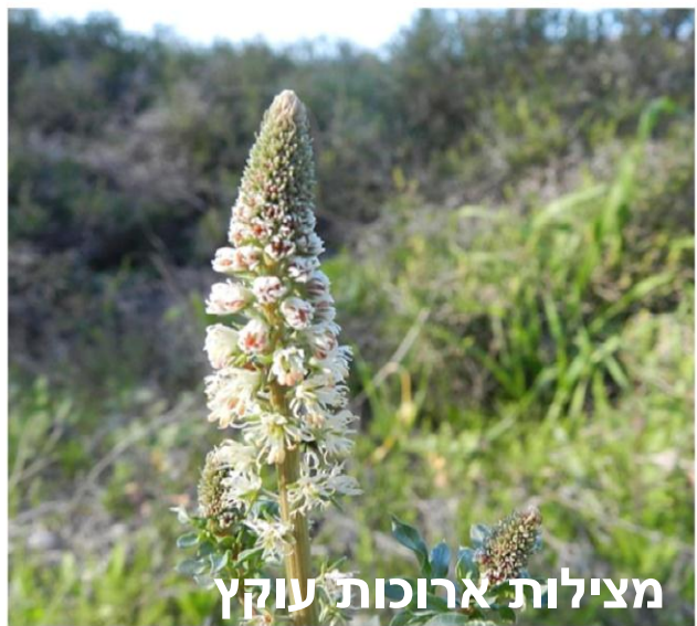
מצילות ארוכות עוקץ