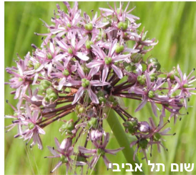
שום תל אביבי