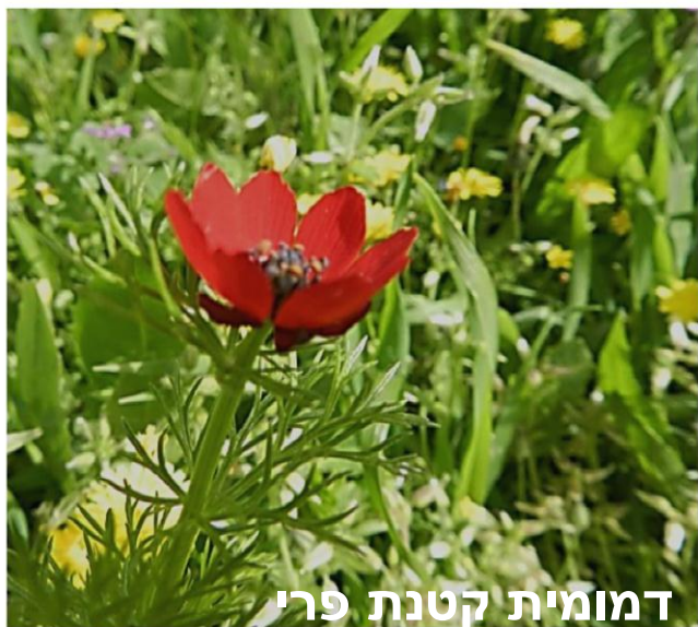
דמומית קטנת פרי