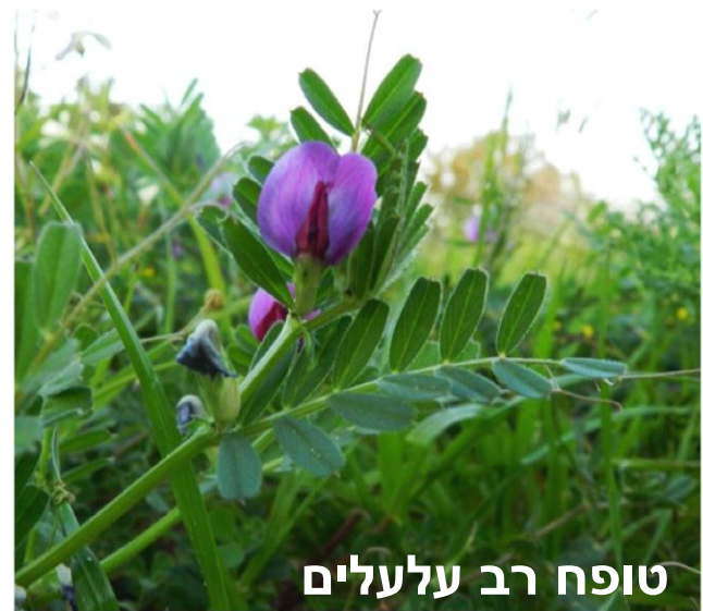
טופח רב עלעלים