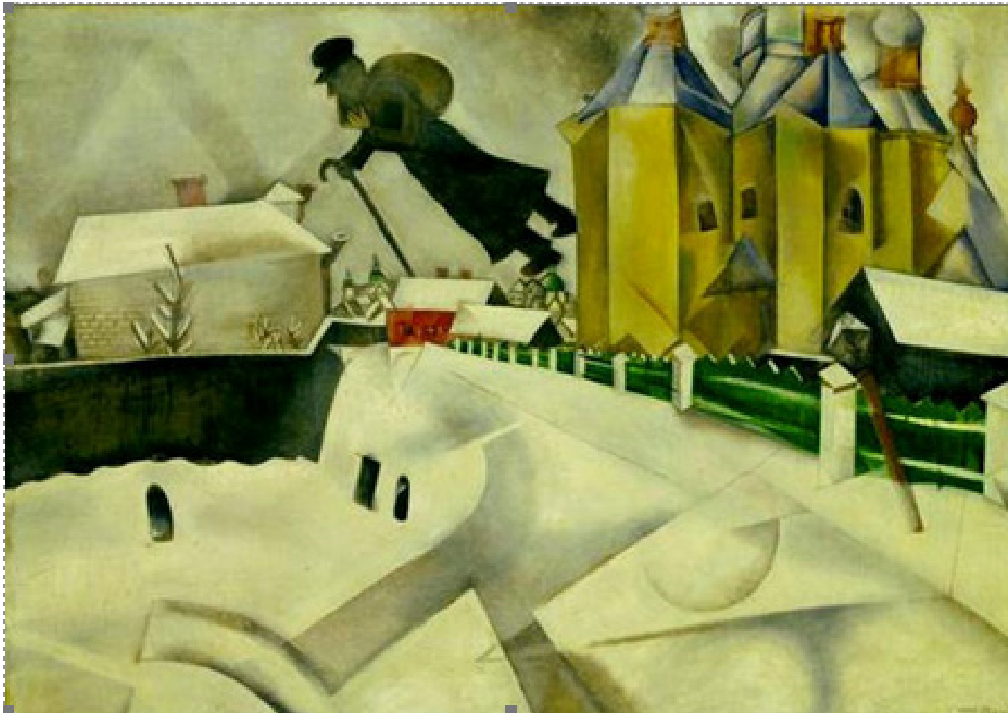
מרק שאגאל, מעל ויטבסק, 1914, שמן על בד