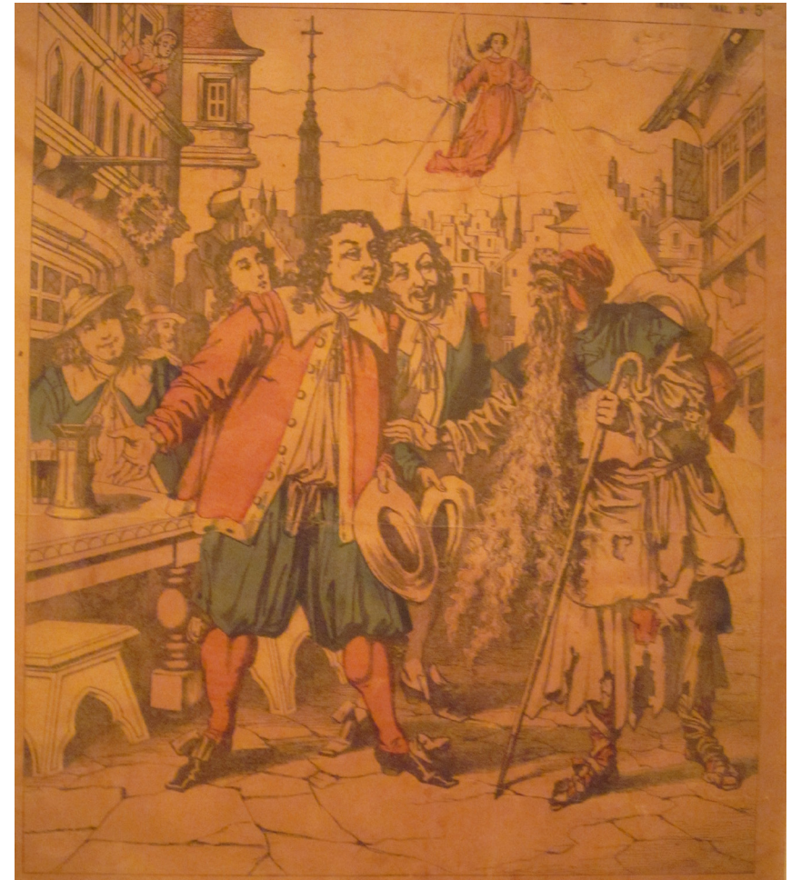
א,ג, מיי, היהודי הנווד, המחצית השנייה של המאה ה-19 צולם במוזיאון ישראל

מה שונה בקודים החזותיים בין שתי התקופות?