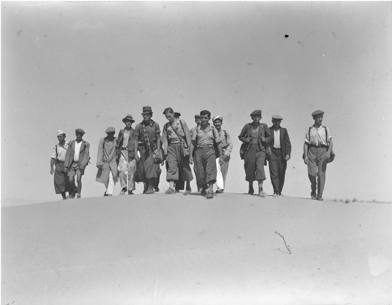
זולטן קלוגר, מעפילים צועדים בחולות ליד נס ציונה, 1939, הדפסה בהזרקת דיו מקור: ארכיון הצילומים של קק"ל