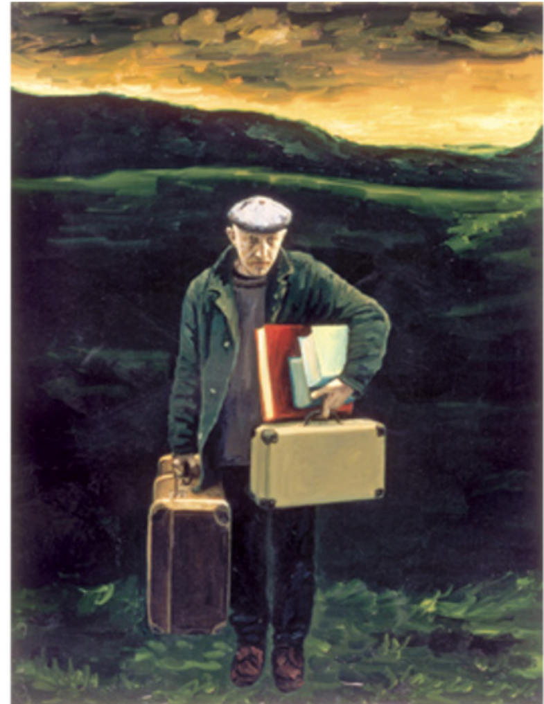
מאיר פיצ'חדזה, דיוקן עצמי כפליט, 1997