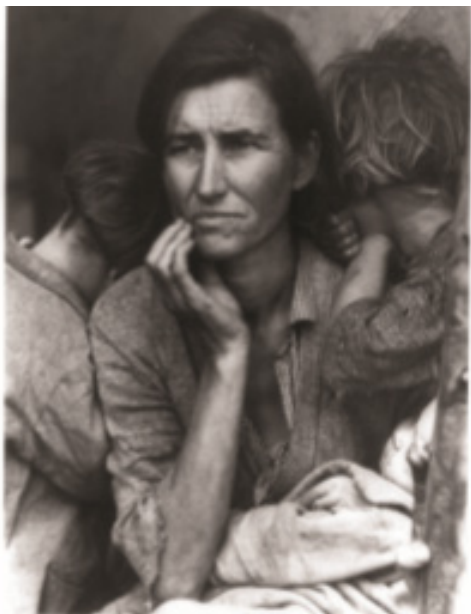
דורותיה לנג, אם נוודית, 1936, צילום

https://www.galleryonline.co.il/%D7%99%D7%91%D7%92%D7%A0%D7%99-%D7%90%D7%91%D7%96%D7%94%D7%90%D7%95%D7%96