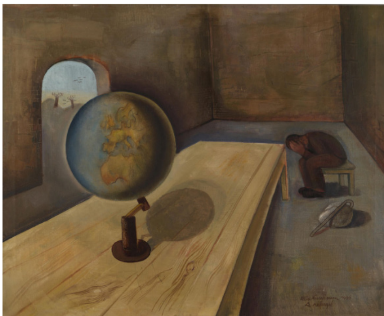
פליקס נוסבאום, הפליט, 1939, שמן על בד