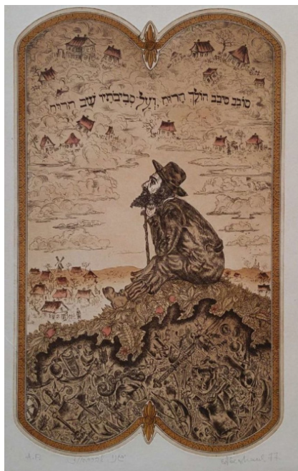
יבגני אבזהאז, היהודי הנודד, ליטוגרפיה מקור: הגלריה און ליין

https://www.galleryonline.co.il/%D7%99%D7%91%D7%92%D7%A0%D7%99-%D7%90%D7%91%D7%96%D7%94%D7%90%D7%95%D7%96