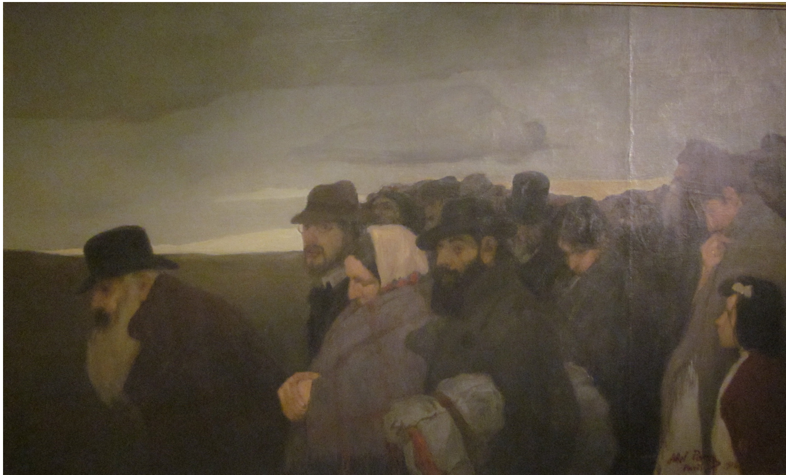
אבל פן, פליטים, 1906, צולם במוזיאון ישראל

האם תחושת הבדידות מאפיינת אף את הייצוגים הללו?