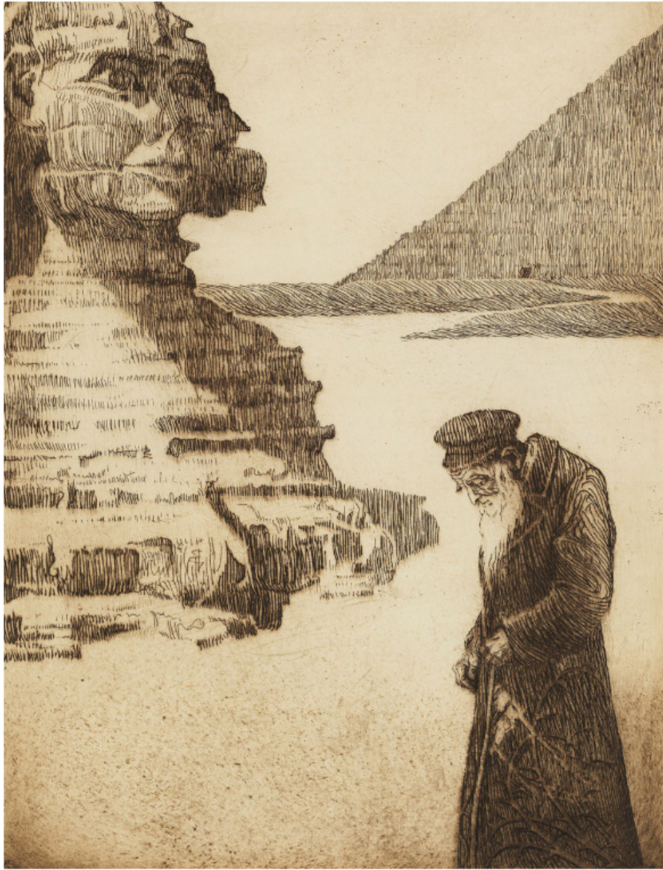
אפרים משה ליליין, ההלך העיף, 1922, תצריב צולם במוזיאון ישראל

האמנים היהודים הדגישו את שפיפות קומתו של היהודי הנודד, את הליכתו המכונסת, את העייפות והשחיקה מגורל הנדודים בשנות הגלות.