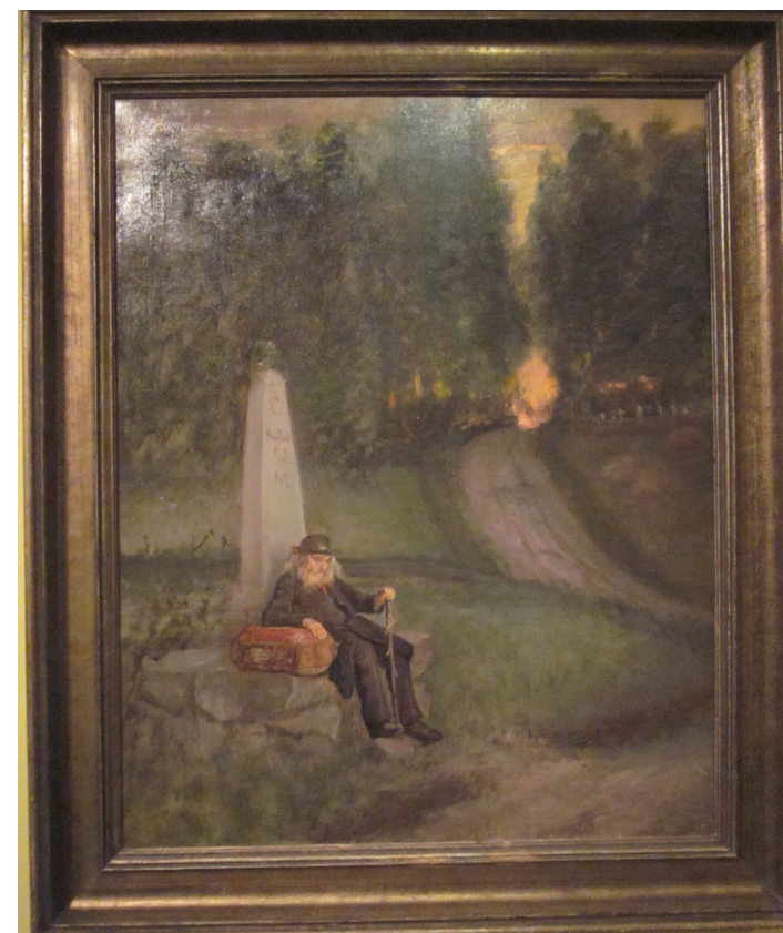
גסקל סלומאן [יליד דנמרק פעל בשבדיה], רוכל יהודי נודד יושב בצד הדרך, לא מתוארך צולם במוזיאון ישראל

אילו רגשות ותחושות מאפיינים את היצירות? כיצד מומחשות תחושות אלו באופן חזותי ביצירות?