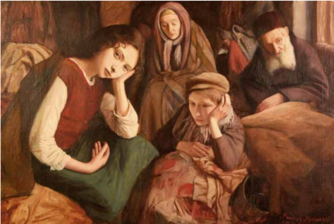
מאוריצי מינקובסקי, המשפחה, 1919, שמן על בד, אוסף קבוצת עזריאלי

האם תחושת הבדידות מאפיינת אף את הייצוגים הללו?