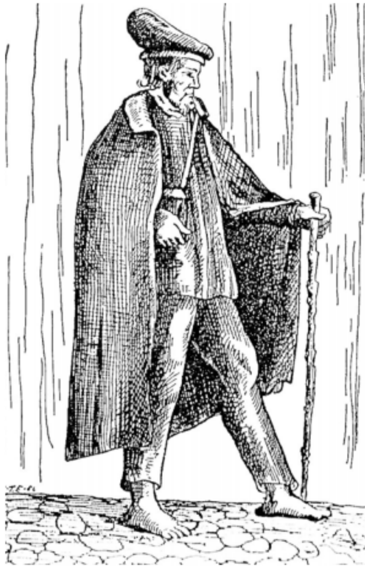
היהודי הנצחי על פי ציור גרמני מהמאה ה-17 מתוך המאמר: "מטה עוזו ותפארתו של היהודי הנווד" מאת זיוה פלדמן, פורסם בכתב העת "נתיב", תשס"ח