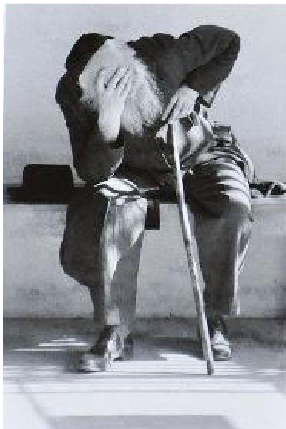
גלוית היהודי הנודד, הצלמניה, טבריה, 1940