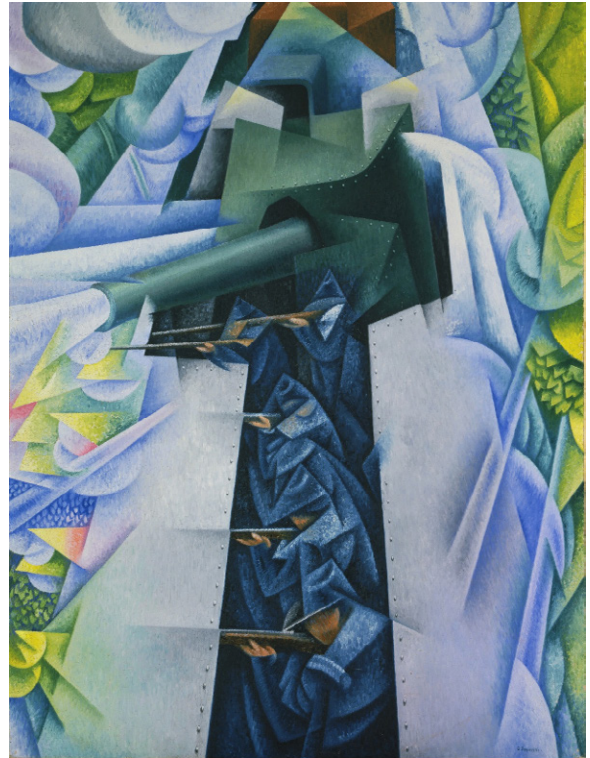
ג'ינו סווריני, רכבת משוריינת בפעולה, 1915.

Gino Severini, Armored Train in Action, 1915. Oil on canvas, 115.8 x 88.5 cm. MoMA, New York. © 2019 Gino Severini / Artists Rights Society (ARS), New York / ADAGP, Paris.