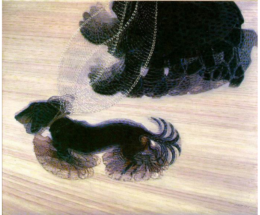
ג'אקומו באלה, דינמיזם של כלבלב ברצועה, שמן על בד, 1912, 89.8X109.8 ס"מ

Giacomo Balla, Dynamism of a Dog on a Leash, 1912 . Oil on canvas, 89.8 × 109.8 cm. Albright-Knox Art Gallery, New York.