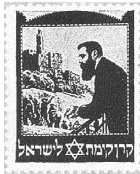
בול קק"ל ועליו דיוקנו של הרצל

בתקופת המעבר מהחלטת האו"ם בכ"ט בנובמבר 1947 ועד הכרזת העצמאות של מדינת ישראל בה' באייר תש"ח (14/5/1948), נזקקה לפתע המדינה לבולים רשמיים. 30 וכך נהפכו בולי קק"ל, בפעם הראשונה בהיסטוריה, לבולים חוקיים לחלוטין למשלוח דואר מארץ-ישראל לרחבי העולם. מצב זה נמשך זמן קצר, ולאחר הכרזת העצמאות החלה המדינה להנפיק בולים משלה, ובולי קק"ל חזרו להיות בולים ייצוגיים. אך מפעל הבולים של "קרן קיימת לישראל" קיים עד היום, והבולים עדיין מספרים את הסיפור של קק"ל ושל מדינת ישראל: הם מתארים את נופי הארץ, היישובים והמוסדות שקמו 35 בה, אישים ידועים, ואת פעילותה של קק"ל במגוון תחומים: יש בולים בנושא סביבה ונוף, בולים בעלי סמל ציוני ובולים שמודפסת עליהם אישיות חשובה.