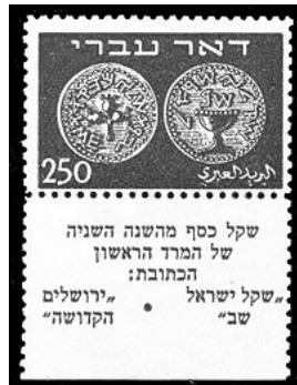
בול "דואר עברי" ושובל

במשך השנים המשיכו להנפיק את סדרת הבולים הזו, וכמו כן הוסיפו לה מטבעות יהודיים מתקופות אחרות ושינו את הכיתוב מ"דואר עברי" ל"ישראל".