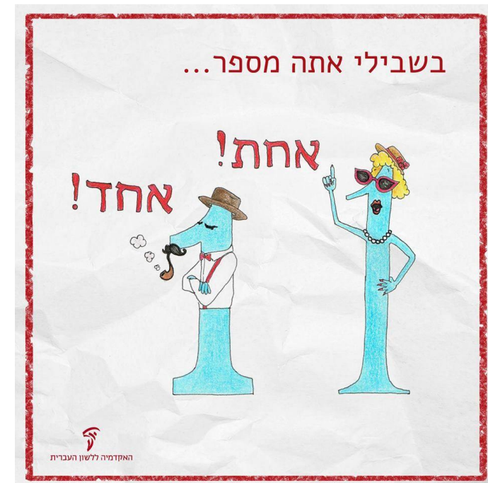
האקדמיה ללשון העברית