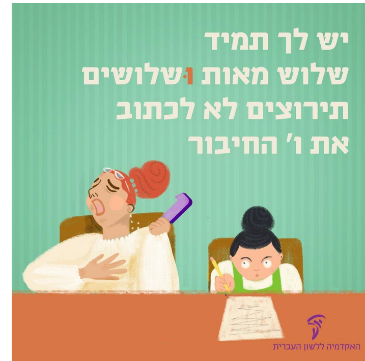
האקדמיה ללשון העברית

מצד שני אין חובה (אך גם אין מניעה) לחזור על ו' החיבור גם לפני האיברים האחרים, כרגיל בלשון המקורות.