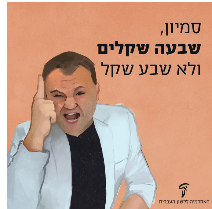
האקדמיה ללשון העברית