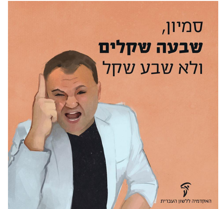
האקדמיה ללשון העברית