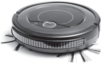
שואב אבק רובוטי

ישנם רובוטים בתעשייה, רובוטים למטרות מחקר וכן רובוטים המבצעים פעולות בבית, כגון שאיבת אבק.