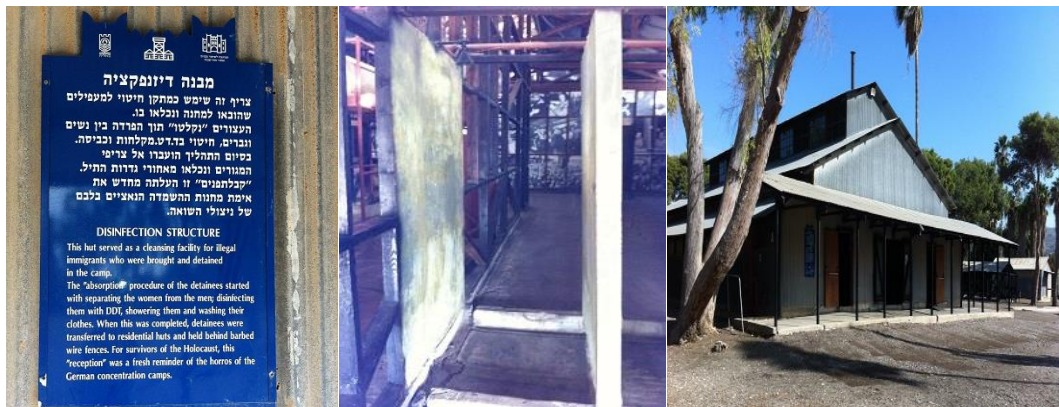
מראה המקלחת מבפנים