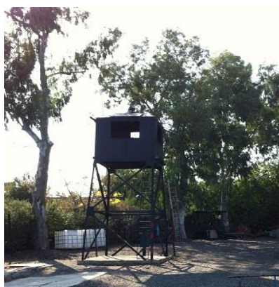
עמדת השמירה במחנה