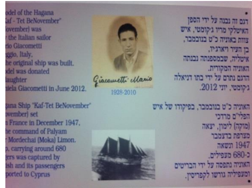
דגם של אוניית המעפילים כ"ט בנובמבר שנבנה על ידי אחד מאנשי הצוות שלה

מחנה עתלית מספר את סיפור התקומה של עם ישראל והמאבק העיקש של אנשיה להגיע לארץ למרות האיסורים וההגבלות של ממשלת בריטניה. הסיפור משלב ציונות, שיתוף פעולה בין גופים שונים במטרה ליצור חברה חדשה בארץ, סולידריות חברתית בין הותיקים לעולים, התארגנות מופתית של היישוב פה בארץ למטרה משותפת לעזור למפעל ההעפלה ואחוות גורל משותפת לכל העם היהודי.