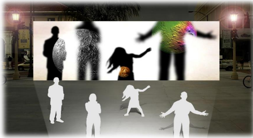
JPL Artist Sheds Light on Pasadena Event.