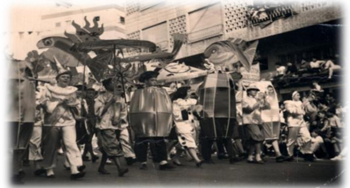
עדלאידע בתל אביב