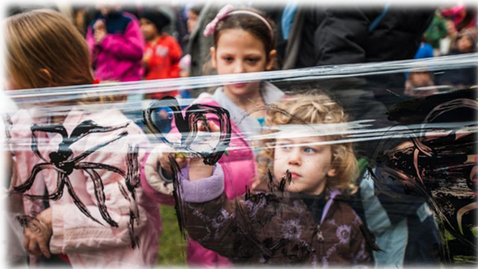
תאטרון המסתורין