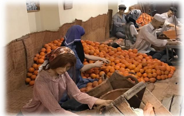
מוזיאון הפרדסנות - ע"ש מינקוב, רחובות