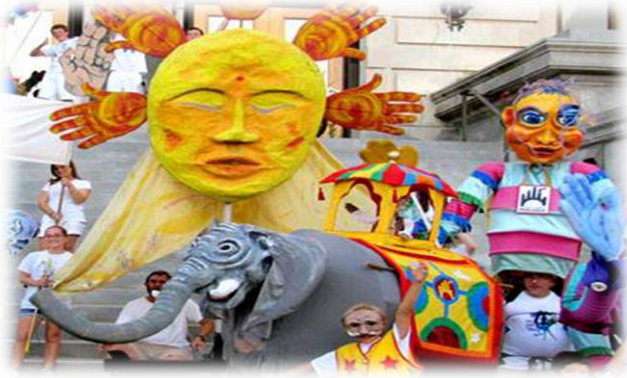
סן פרנסיסקו מיימ טרופ