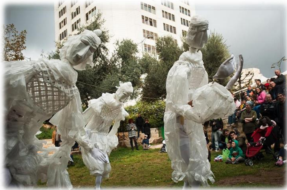
תאטרון המסתורין