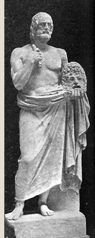
פסל המתאר את המחזאי אוריפידס מחזיק מסכה