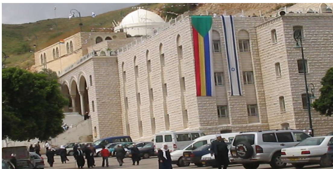
(בתמונה: קבר הנביא שועיב עליו השלום ליד כפר חטים)

קברים נוספים: קבר הנביא אלח'דר עליו השלום, קבר הנביא סבלאן עליו השלום בכפר חורפיש, עוד..