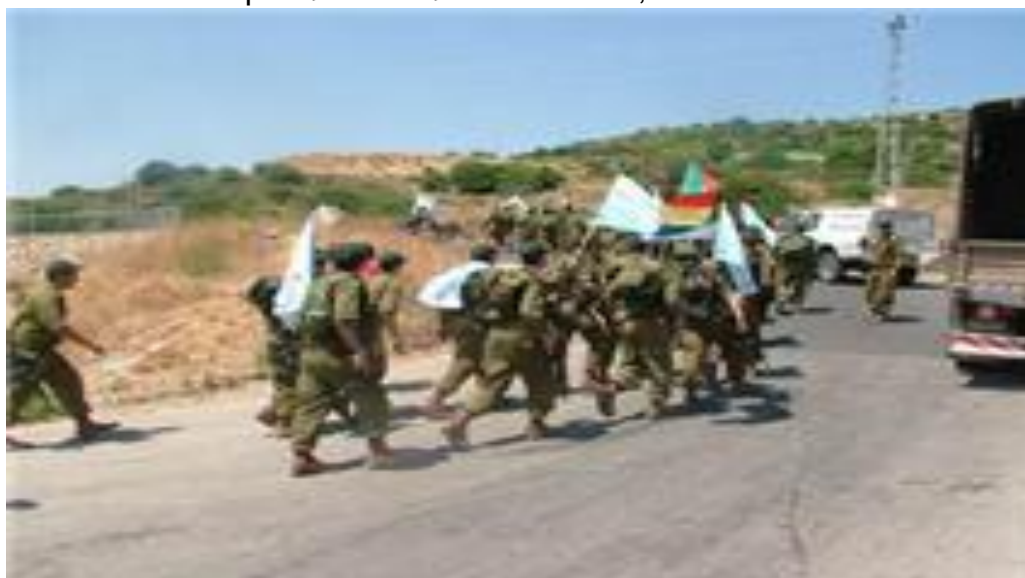
(בתמונה: מסע כומתה של יחידת הדרוזים 300)

זו התפיסה המרכזית בחברה הדרוזית בישראל, והיא באה לידי ביטוי בשני תחומים: ההצבעה בבחירות: חב הדרוזים מצביעים בבחירות לכנסת למפלגות ציוניות, מימוש חובת הגיוס לצה"ל: חב הדרוזים מתגייסים לצה"ל ומשרתים בו בנאמנות, ורבים מבני הדעה נמנים עם הקצונה הבכירה.