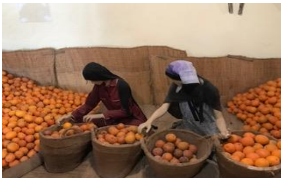
מוזיאון הפרדסמת - ע"ש מינקוב, רחובות